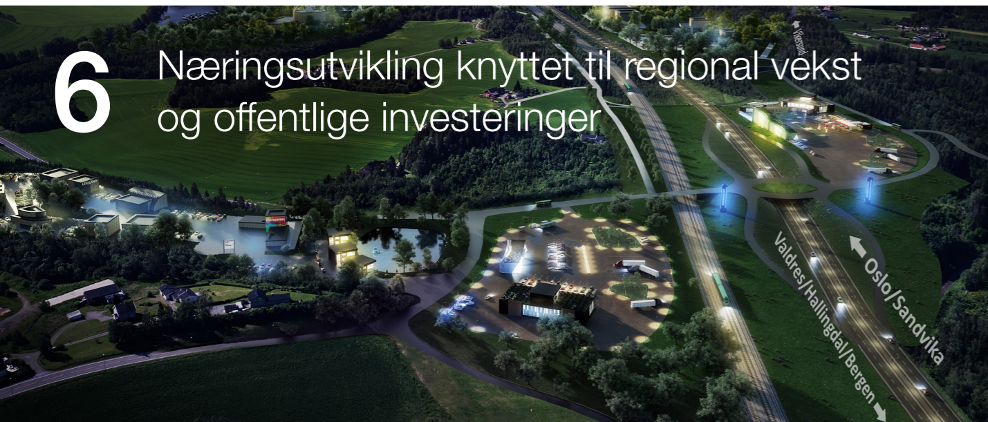
Illustrasjon: AKKA as

Synliggjøre hvilke muligheter gründere og innovative regionale virksomheter har for leveranse gjennom offentlige innkjøp og underleveranser til regionale investeringer. Bidra til at kommunen kan levere mer innovative produkter og tjenester til innbyggerne gjennom de mulighetene som gis gjennom anbud og offentlige anskaffelser.