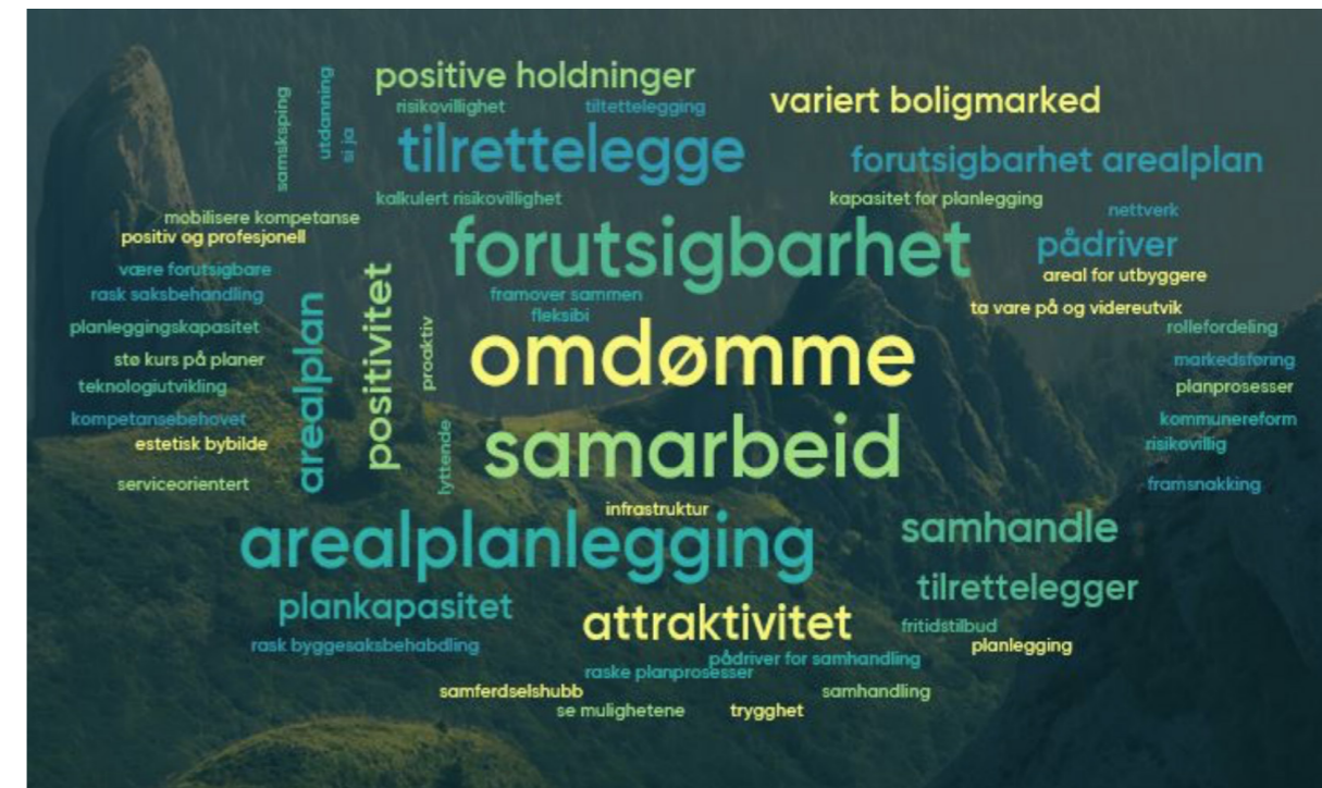
Illustrasjon: Temperaturmåling fra første frokostmøte med næringslivet.

Næringslivets tilbakemeldinger er at det viktigste kommunen gjør, er å ha raske og forutsigbare reguleringsplanprosesser. I tillegg er blant annet samarbeid, omdømme og forutsigbarhet noe de legger vekt på.