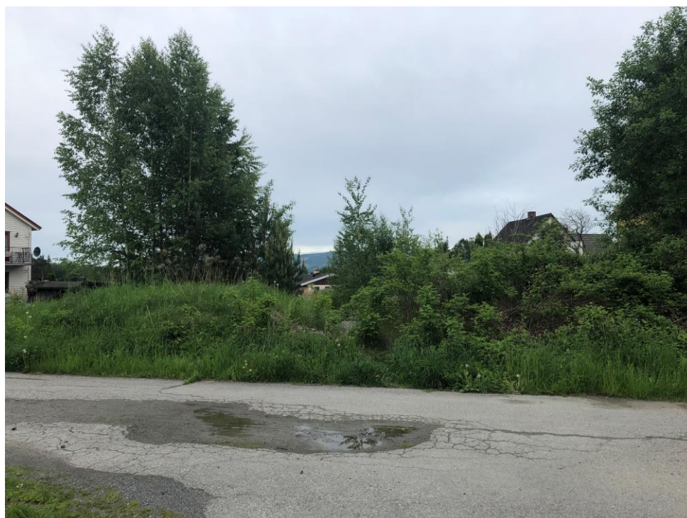
Område sett fra Ludvik Grønvolds vei

Friområdet som søkes omregulert er i dag i ferd med å gro igjen med løvskog og bringebærbusker, se bilder. Gamle og forfalne lekeapparater kan en se inn i mellom trær og busker. Den enden som ikke foreløpig er særlig tilvokst benyttes gjerne av beboere rundt som parkeringsplass.