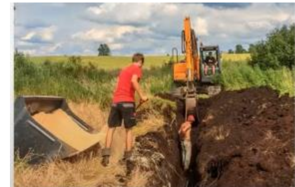
Annen grøfting (usystematisk)