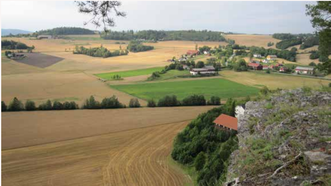
Steinssletta sett fra Bureknatten