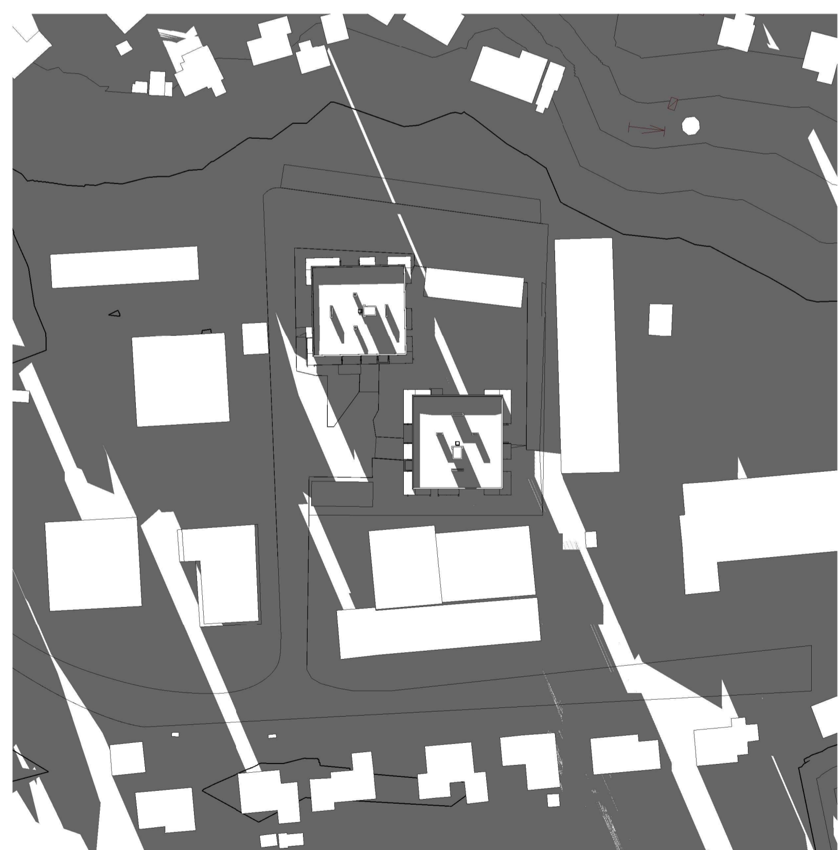
21. Mars 18.00 1 : 1000