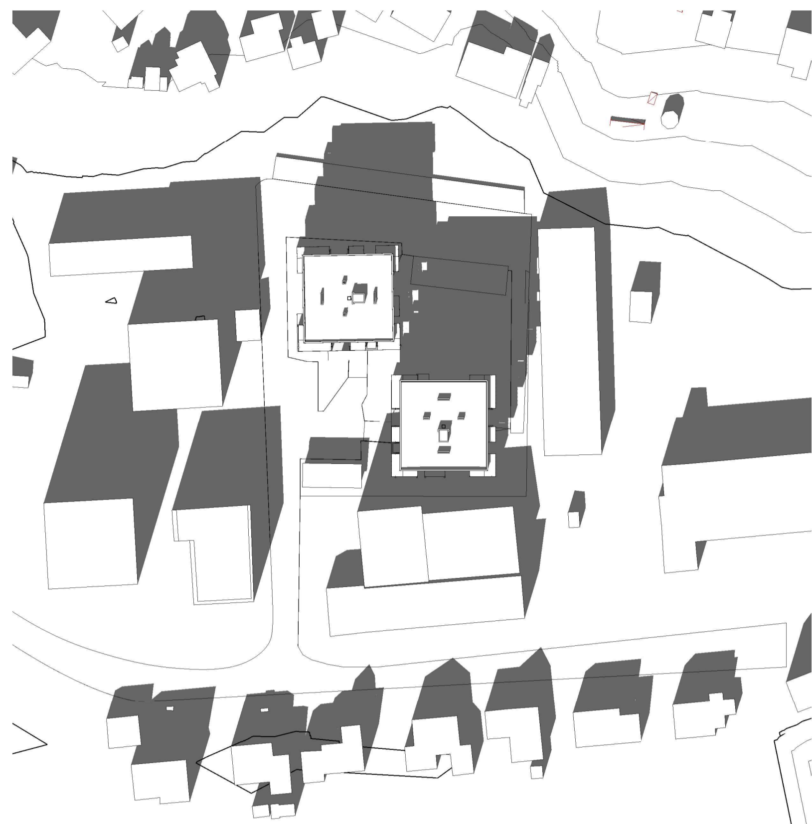
21. Mars 09.00 1 : 1000