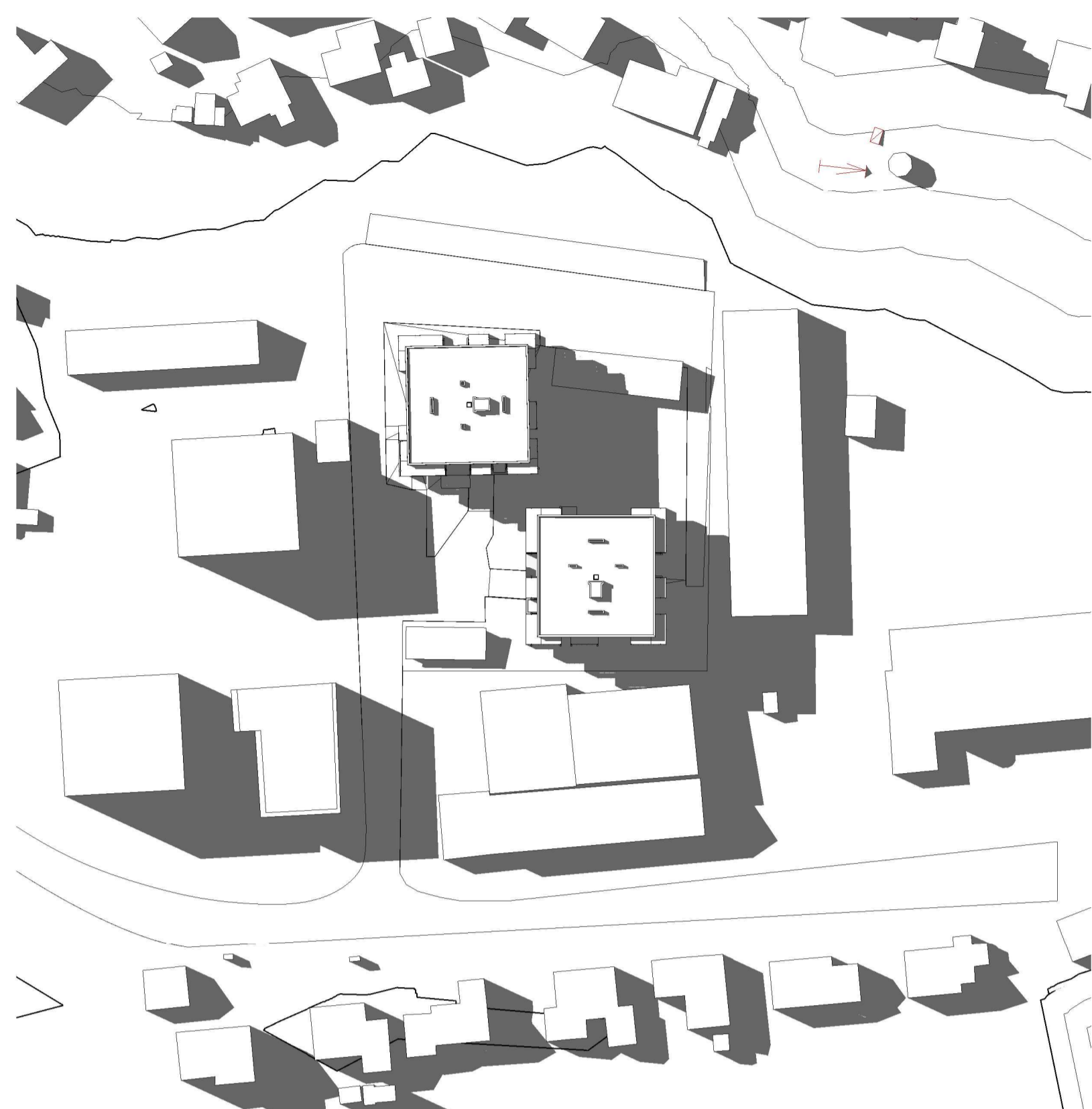
21. Mars 15.00 1 : 1000