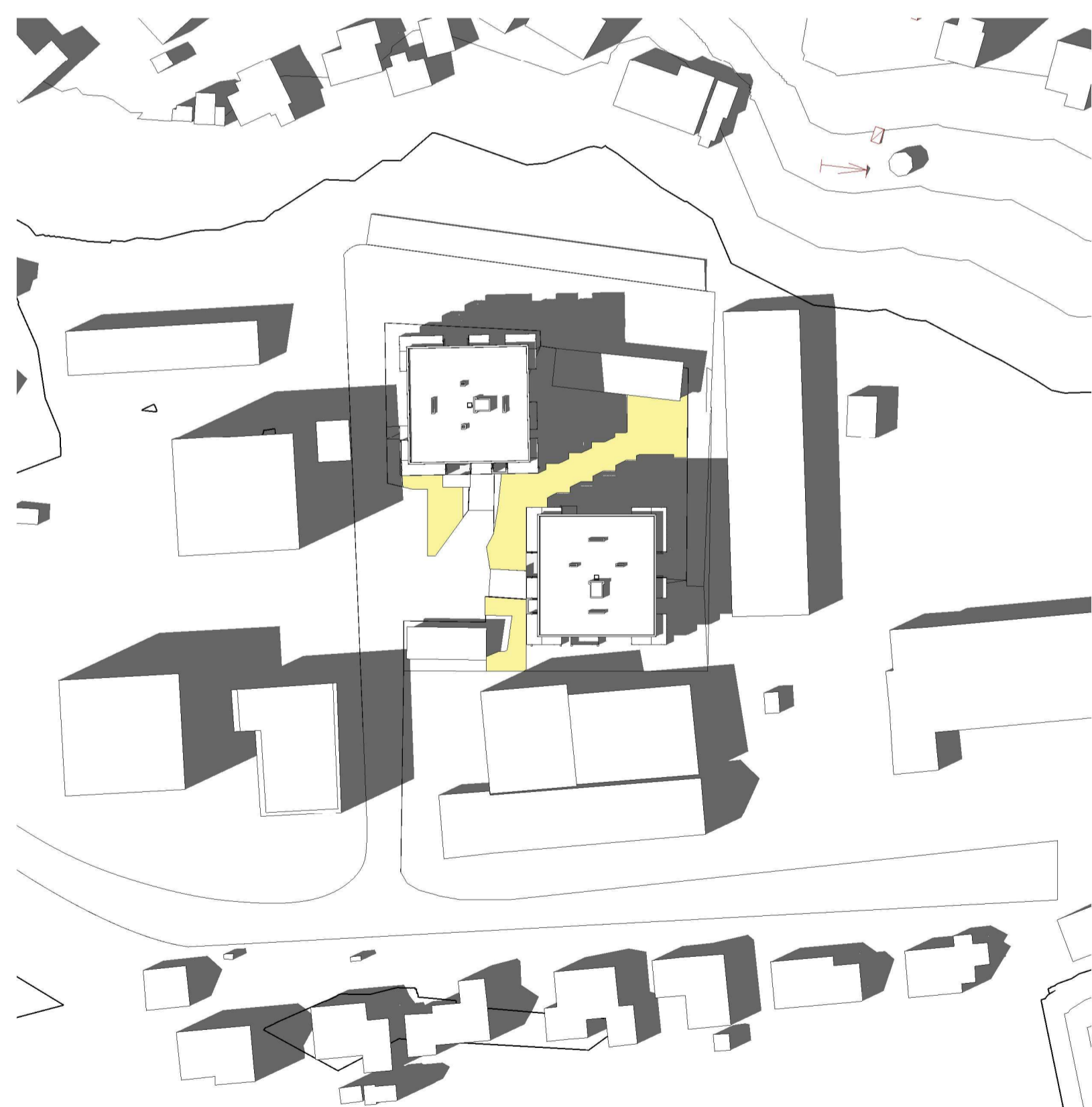
21. Mars 12.00 1 : 1000