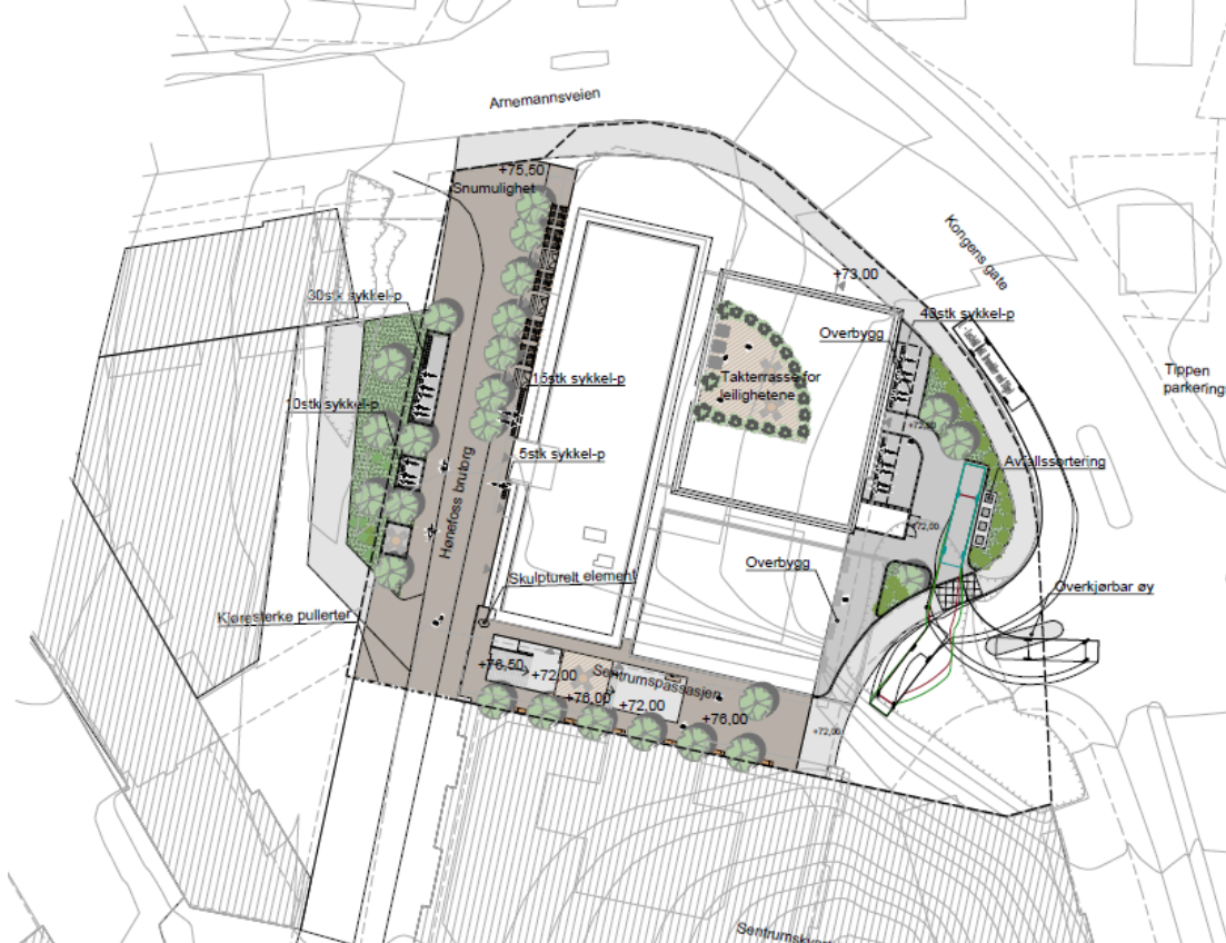
Figur 2 Illustrasjonsplan for planområdet til 488 – Alles kulturhus

Under er utsnitt av illustrasjonsplanen, som viser særlig hvordan utearealene er planlagt.