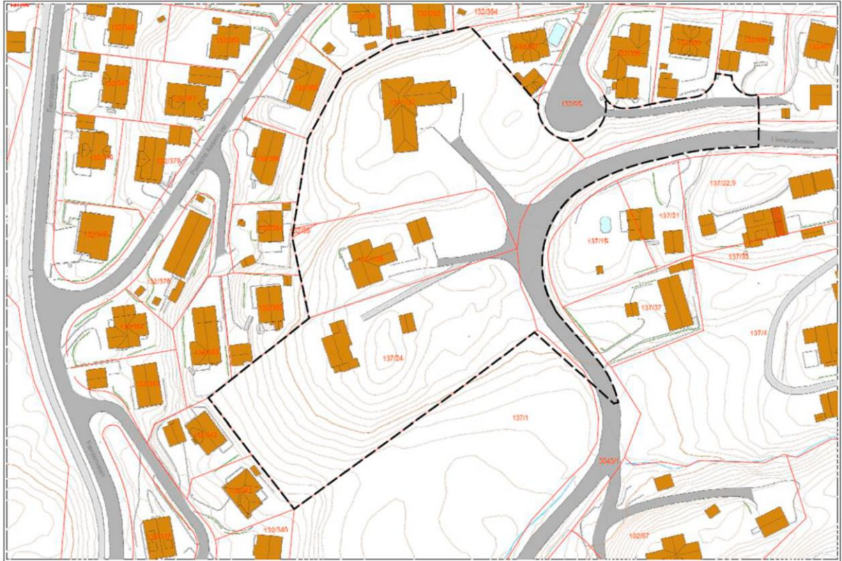
Figur 2: Planavgrensing