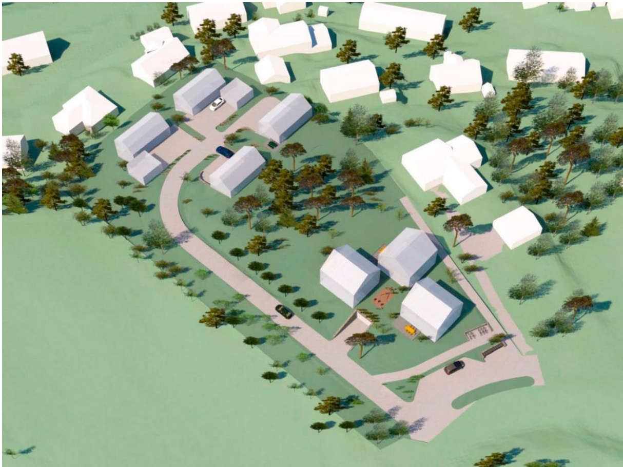
Figur 4: Skisse. Ny bebyggelse i grått