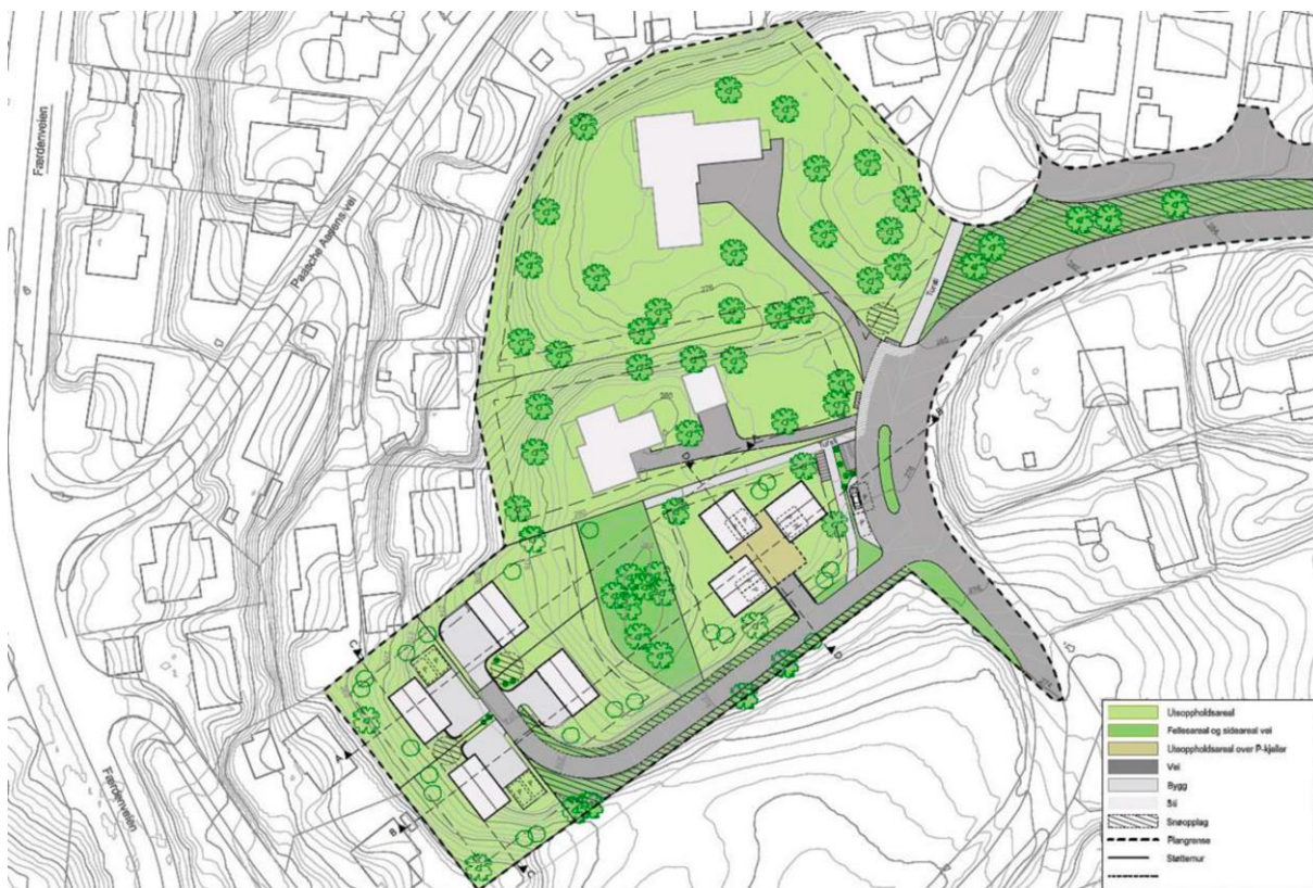
Figur 3: Utsnitt fra illustrasjonsplan

Hovedformålet med planen er å regulere til fortetting av eiendommen gnr/bnr 137/24. For å sikre helhetlig plan for område og sikker skolevei, er naboeiendommene 137/1/28 og 137/1/27 tatt med i planområdet.