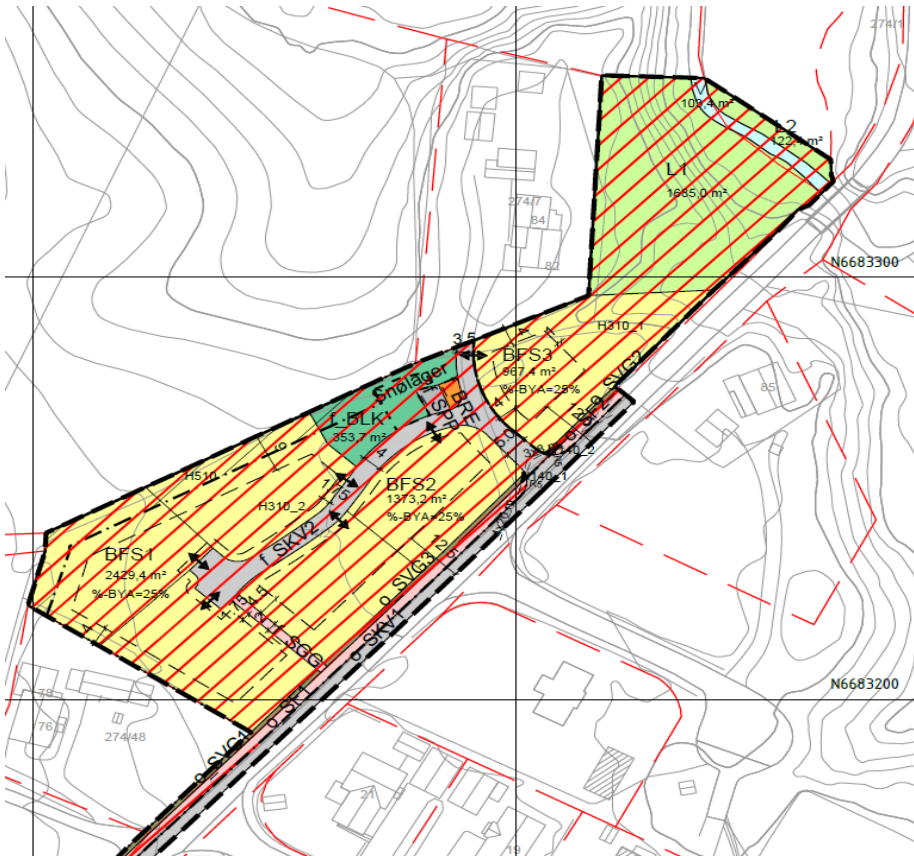
Figur 2: Utsnitt av reguleringsplanen og planavgrensning

For å hindre avdrift av støv og sprøtemiddel fra tilgrensende landbruksarealer inn på lekeplassen og inn mot bebyggelsen, er det regulert inn en buffersoner på 5 meter og byggegrense på 9 meter mot landbruksområdet. Buffersoner på 5 meter skal beplantes med tett vegetasjon ved lekeplassen og ved bebyggelsen, dette er ivaretatt i reguleringsbestemmelsene. Statsforvalteren i Oslo og Viken anbefalte at området på 5 meter buffersoner skulle reguleres som LNF- området. Rådmannen mener at det er tilstrekkelig at 5 meter buffersonen sikres med hensynssone i plankartet og at bestemmelsene angir at området skal beplantes med tett buskvegetasjon.