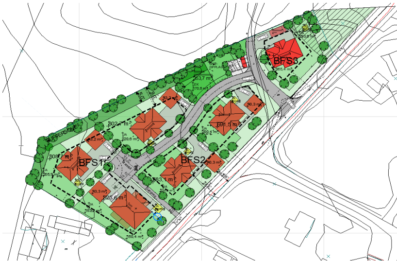
Figur 3: Utsnitt fra illustrasjonsplan