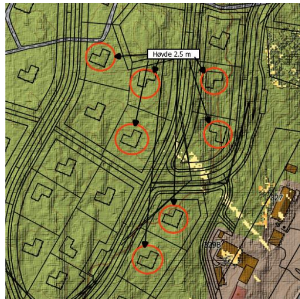
Figur 1: Tomtene som må ha redusert tillatt byggehøyde er vist i analysen med røde sirkler.

Høydedata er innsamlet med laser flystripe. Dato for datafangst er 07.06.2016. Det ble foretatt hogst i området fra desember 2018. Det er foretatt feltarbeid høsten 2020 og målt inn eksisterende vegetasjon i området, slik at vegetasjon som vises i analysen i planområdet og like øst for vikersundvegen er verifisert.