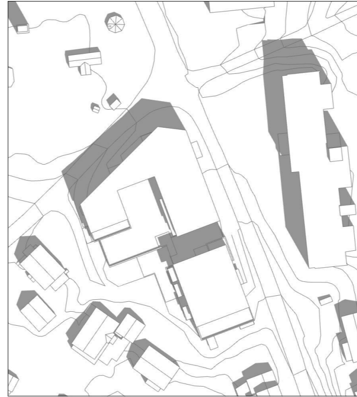
21.juni kl 12