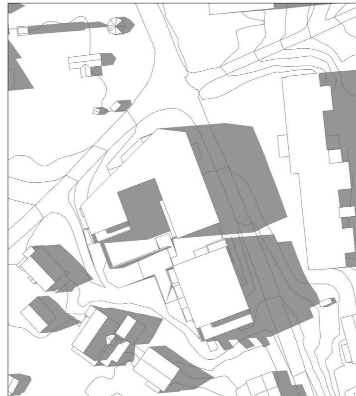
21.juni kl 18