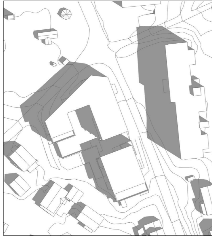
21.juni kl 10.30