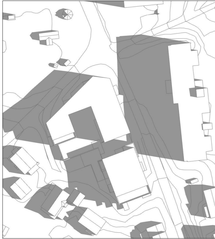
21.juni kl 09