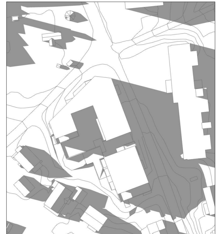
21.juni kl 19.30