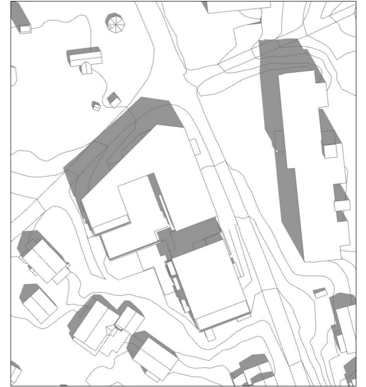
21.juni kl 13.30