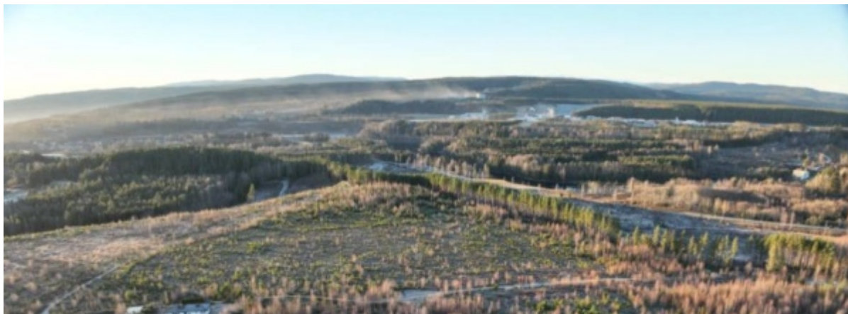
Figur 2: Oversiktsbilde av planområdet på Børdalsmoen. Figur hentet fra planprogrammets side 26.