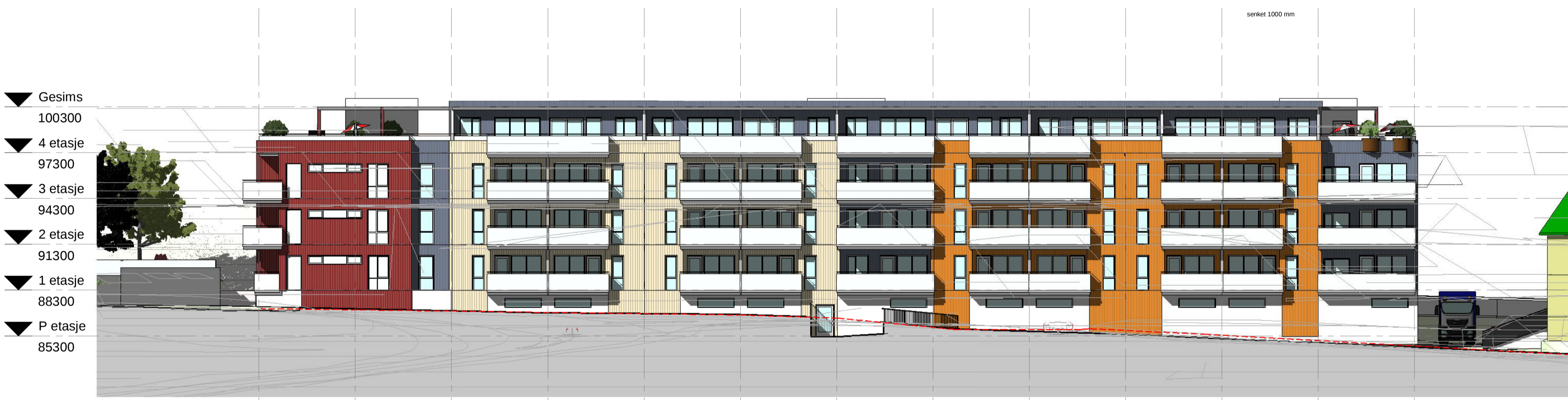
fasade Sørøst 1 : 200