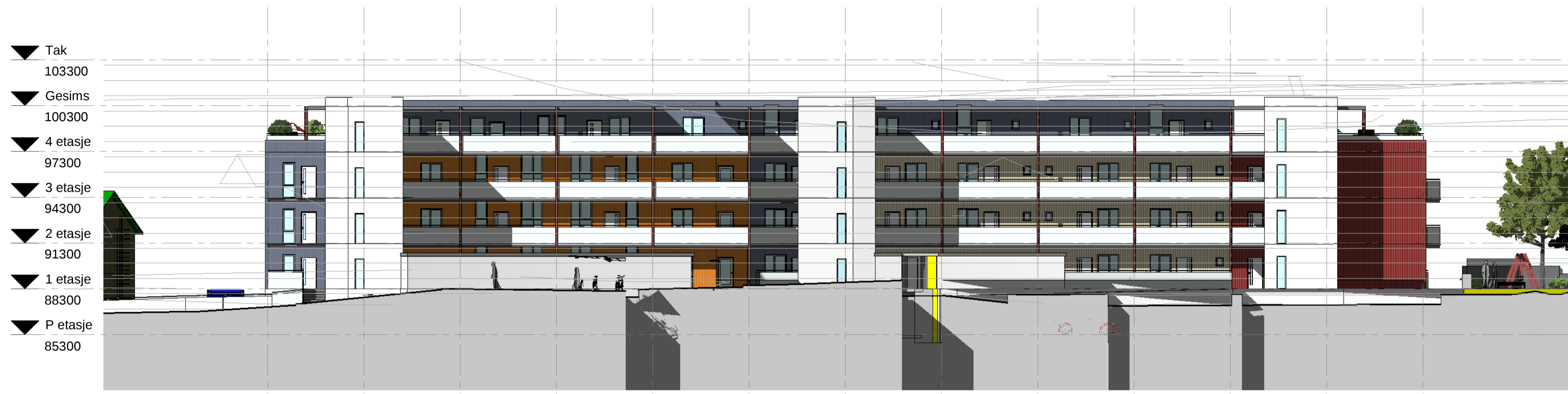
fasade nordvest 1 : 200