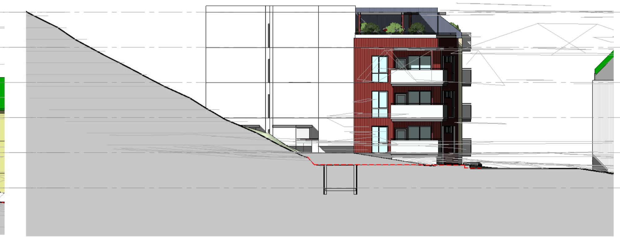
fasade Sørvest 1 : 200