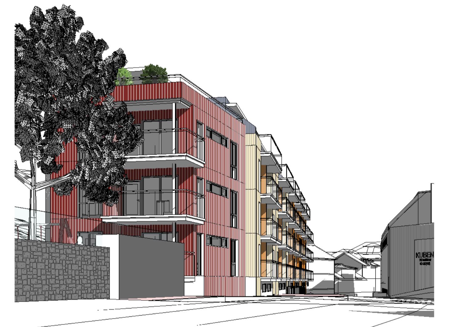
nærmiljø fra vest