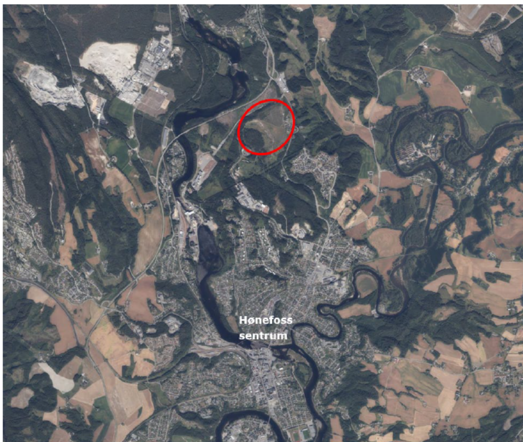
Figur 1: Oversiktsbilder over planområdets plassering i Hønefoss.

eiendommer; gnr/bnr 87/595, 87/594, 87/591, og 89/347.