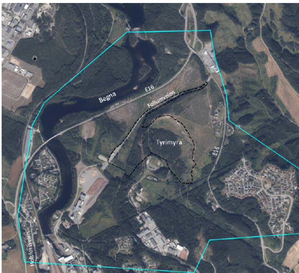
Figur 2: Planområdet planavgrønsning er vist med sorte streker omtrent midt i kartutsnittet.