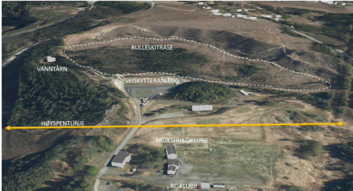
Figur 3: Illustrasjon av dagens bruk av planområdet om områdene rundt.

Arealet er i dag ubebygd, og består av en skogkledd ås i vest og en skogkledd flate, hvor selve Tyrimyra ligger. Planområdet grenser i sør til et skiskytteranlegg med skytebane og rulleskitrase. Rulleskitraseen går gjennom planområdet. På åsen i vest er det i dag et vanntårn med tilhørende infrastruktur. Det går en høyspentlinje sør for planområdet.