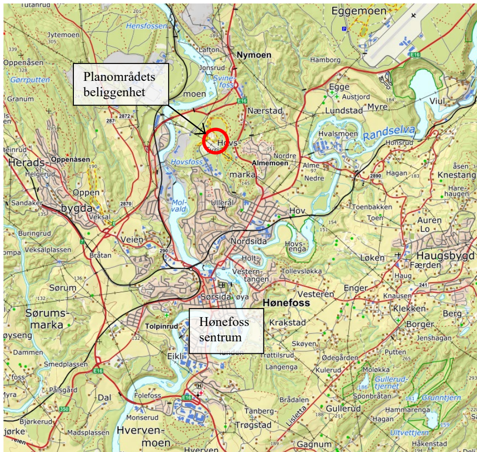
Figur 1: Planområdets beliggenhet. Illustrasjon: COWI, basiskart: norgeskart.no