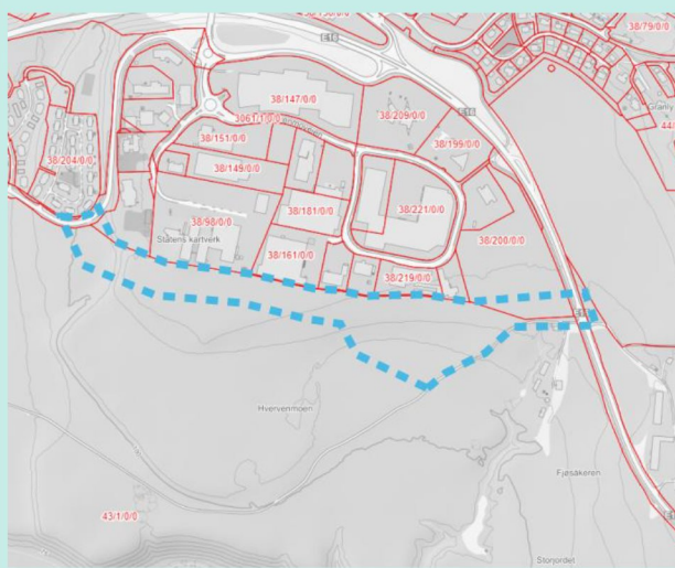
Figur 1. Foreslått planområde.