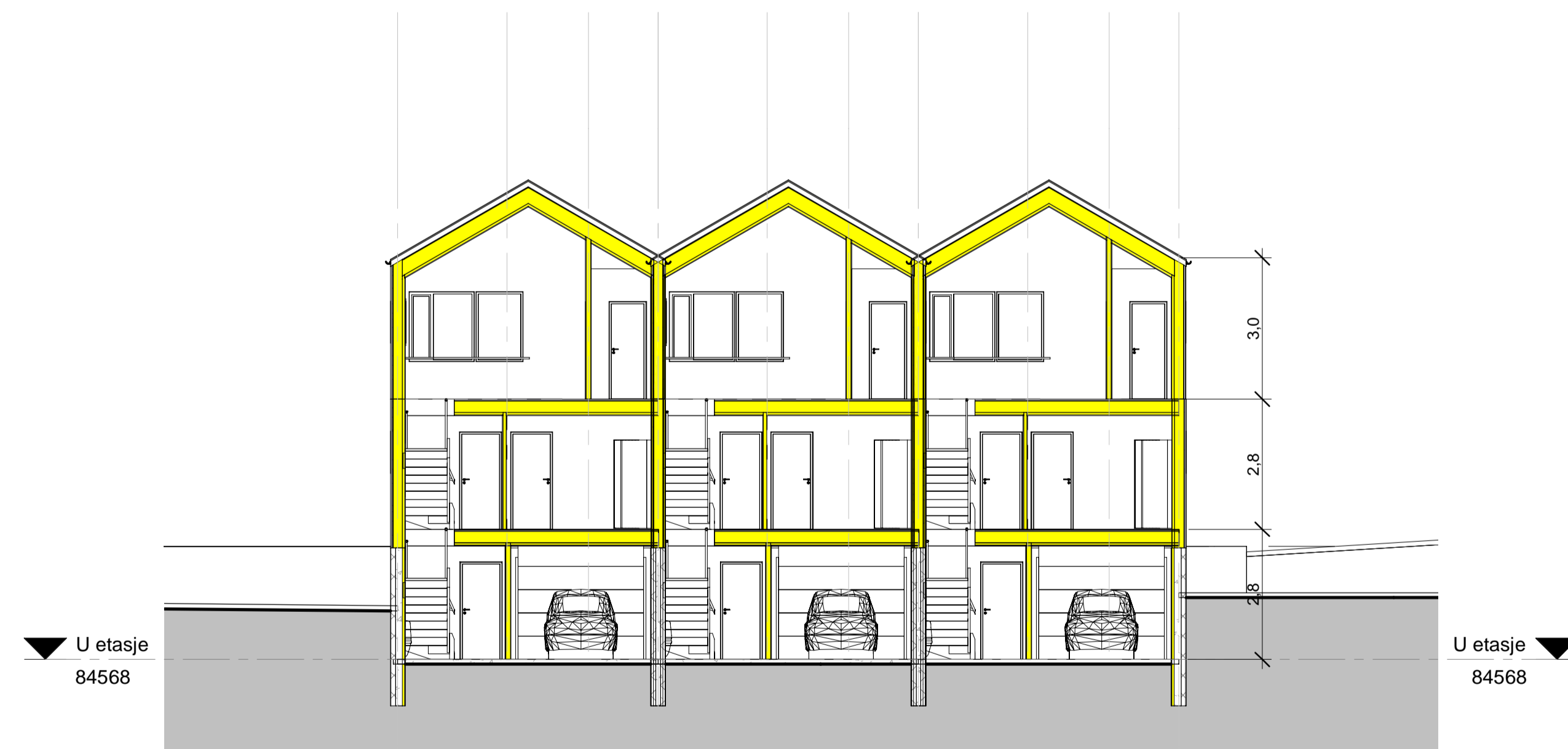
Snitt A A 1 : 100