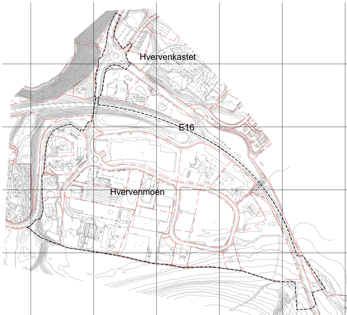
Figur 1 – planens avgrensning

Det kan bli aktuelt å justere planavgrensningen noe underveis i den videre prosessen, ut ifra hva som er hensiktsmessig i forhold til trafikkavvikling for området. Planområdet samsvarer med planområdet for tidligere vedtakelse av planen, i tillegg til at den er utvidet noe i øst og vest for å sikre en helhetlig plan for Hvervenmoen.