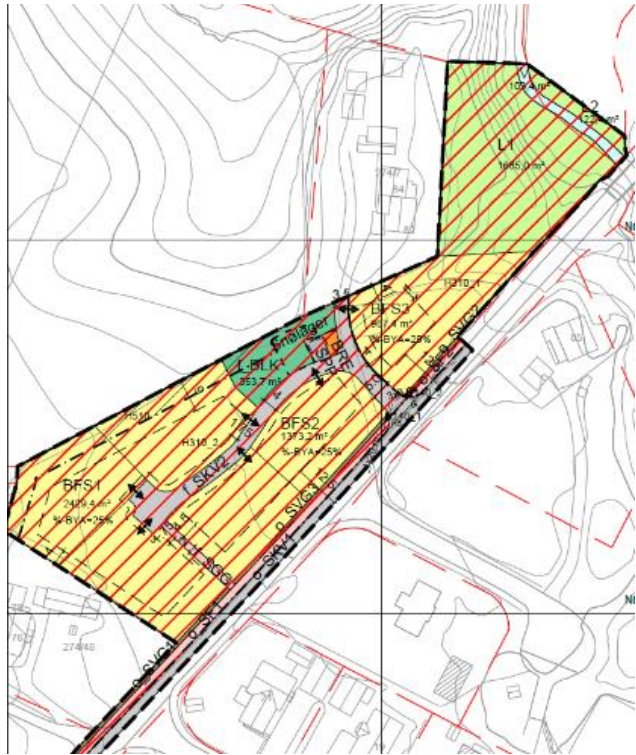
Utvidelse av forslag til plankart.