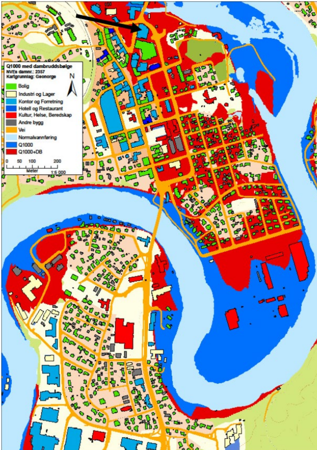
Figur 4-1 Dambruddskart for området bak Sagdammen. Planområdet markert med sort pil øverst i figuren.