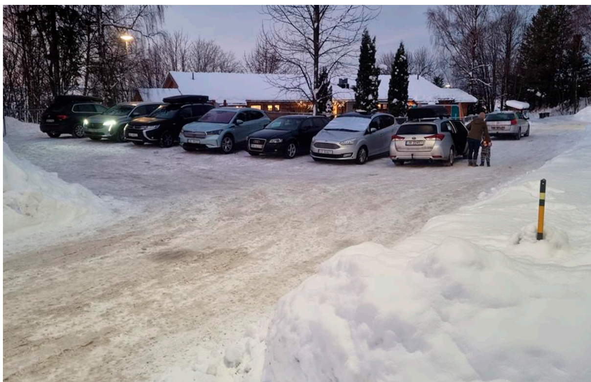
Bilder fra en vanlig morgen, onsdag 25. januar før befaringen med forslagsstiller