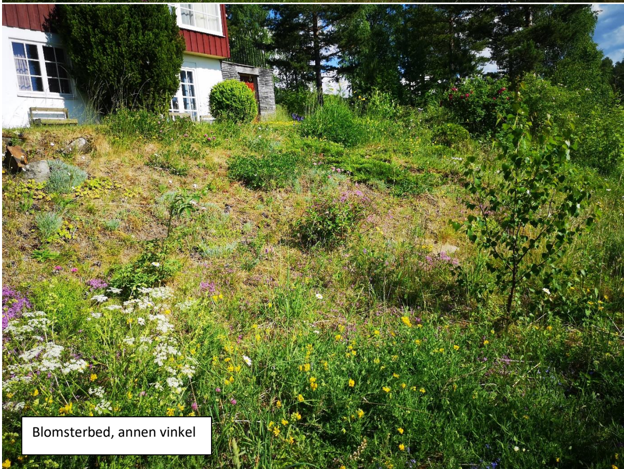
Blomsterbed, annen vinkel