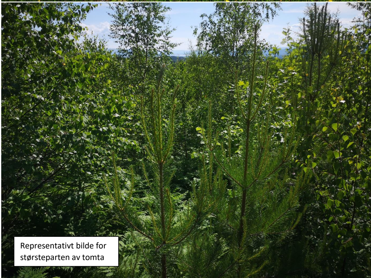
Representativt bilde for størsteparten av tomta