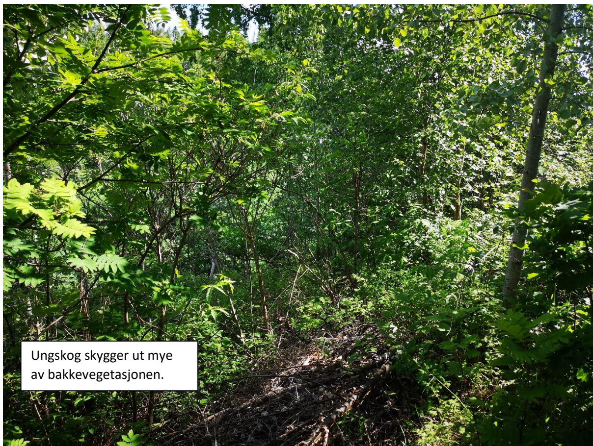
Ungskog skygger ut mye av bakkevegetasjonen.