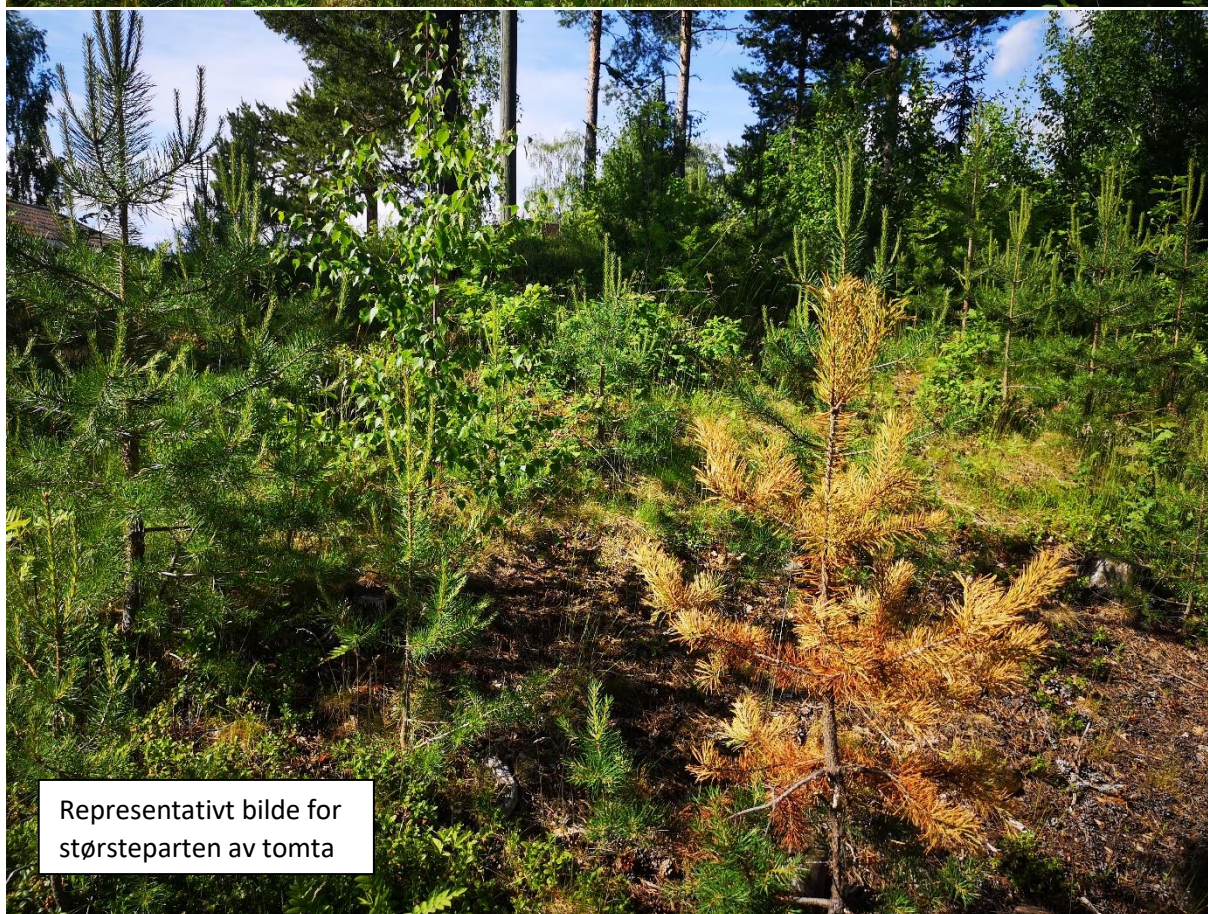
Representativt bilde for størsteparten av tomta