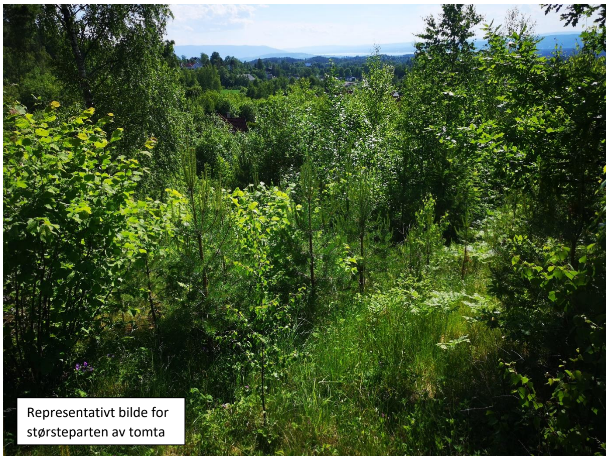
Representativt bilde for størsteparten av tomta