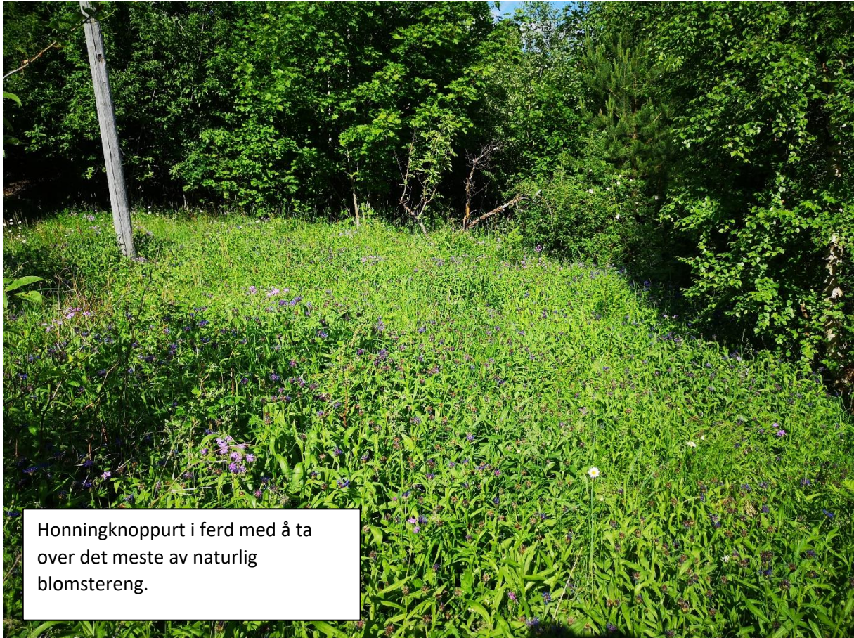
Honningknoppurt i ferd med å ta over det meste av naturlig blomstereng.