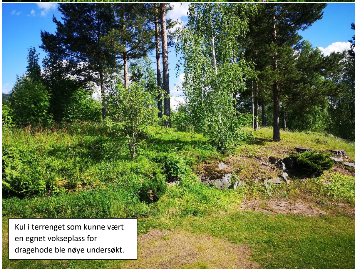
Kul i terrenget som kunne vært en egnet vokseplass for dragehode ble nøye undersøkt.