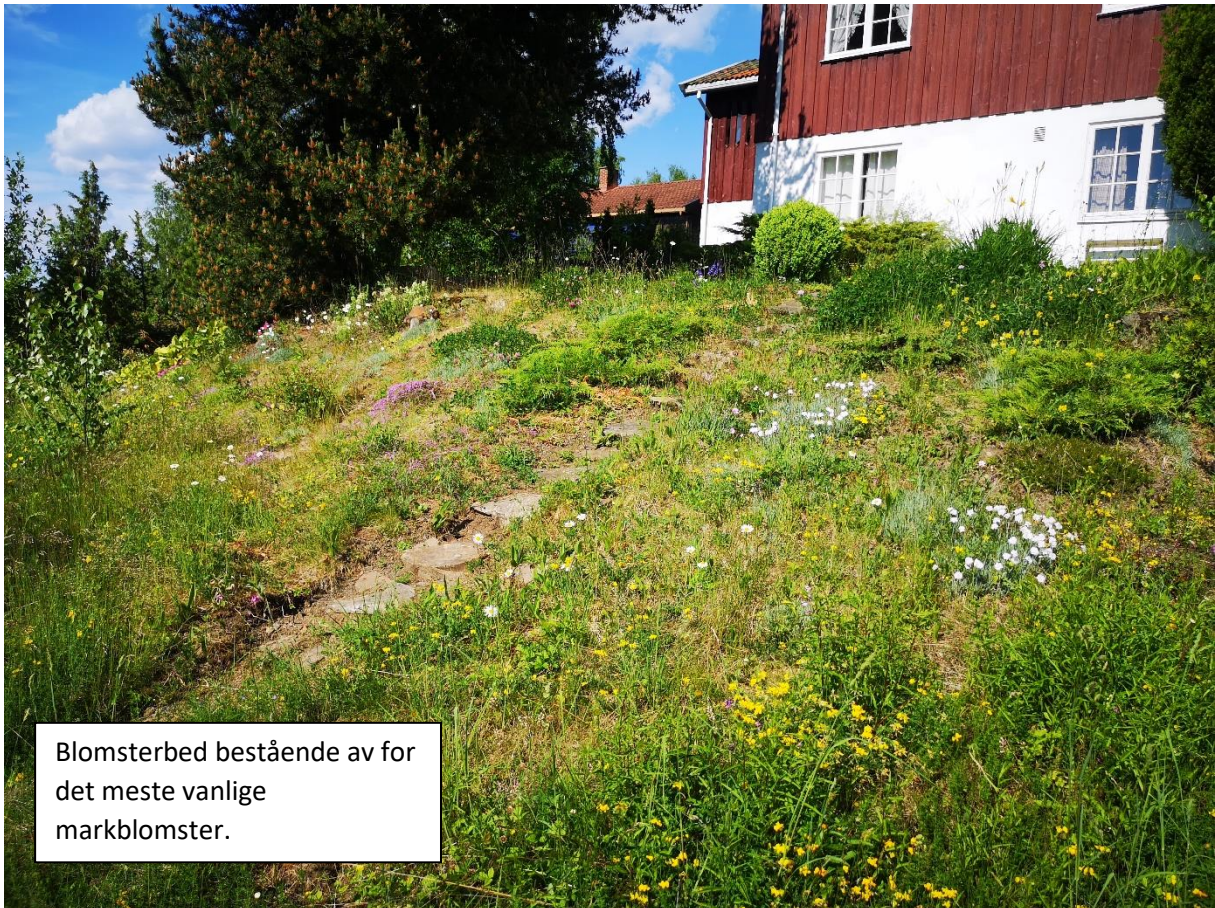
Blomsterbed bestående av for det meste vanlige markblomster.