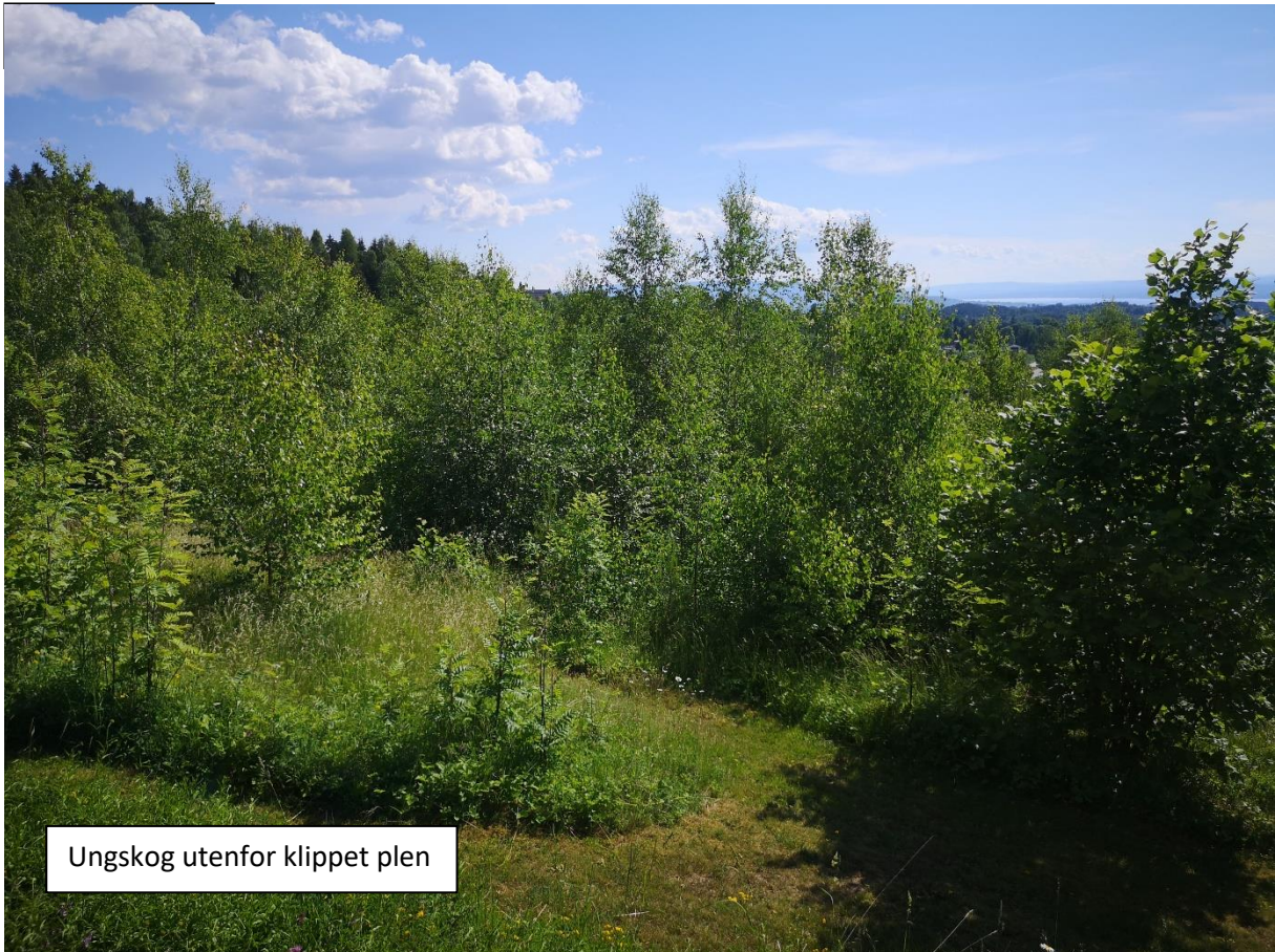
Ungskog utenfor klippet plen