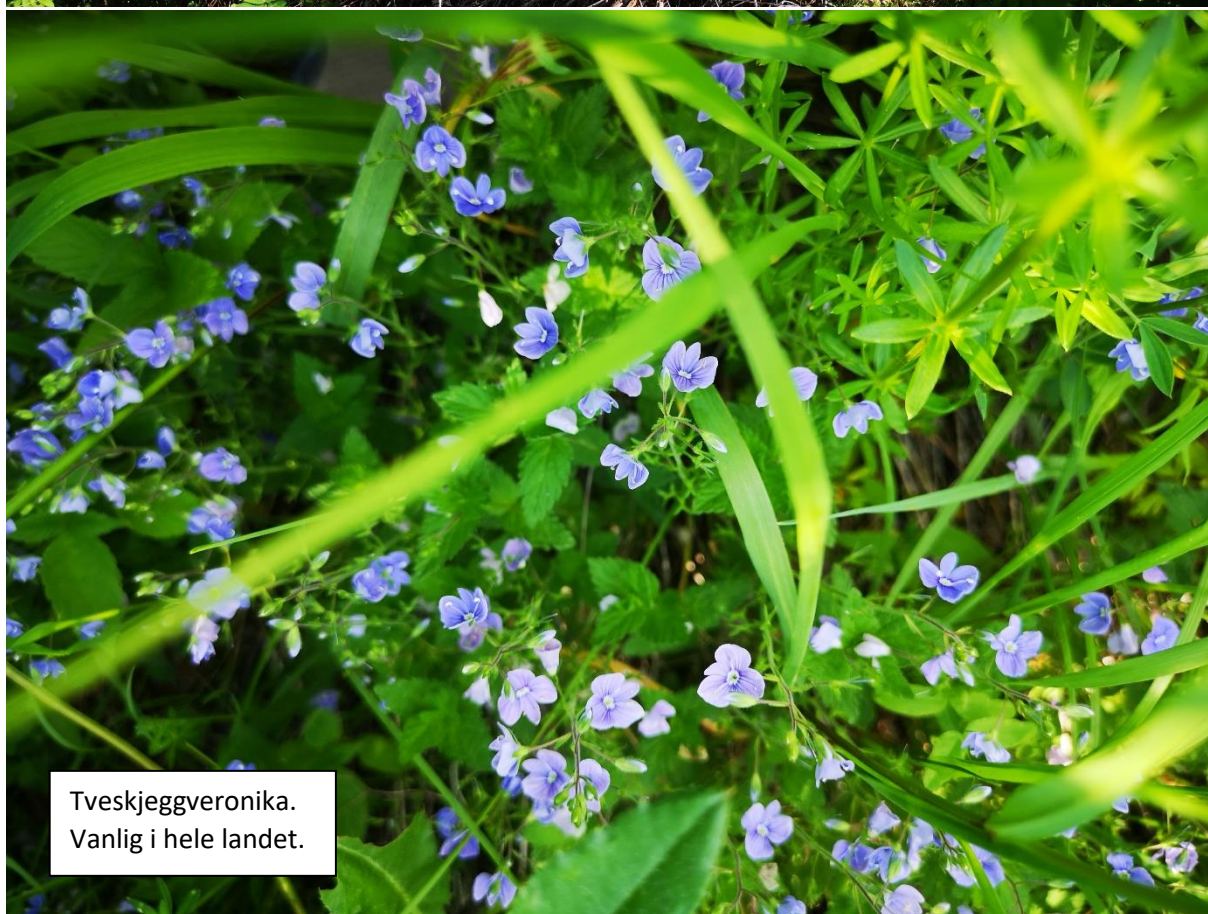
Tveskjeggveronika. Vanlig i hele landet.