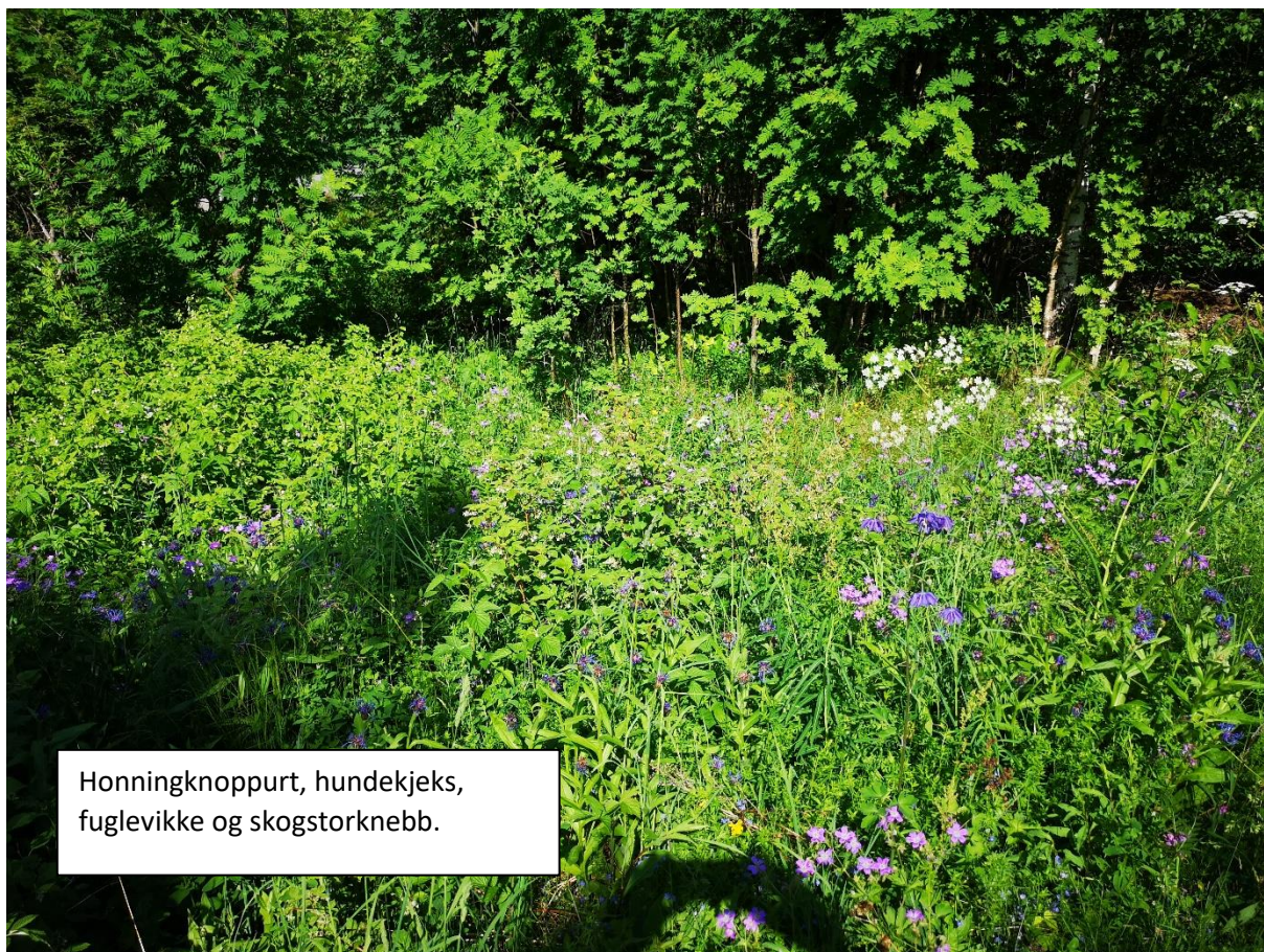
Honningknoppurt, hundekjeks, fuglevikke og skogstorknebb.