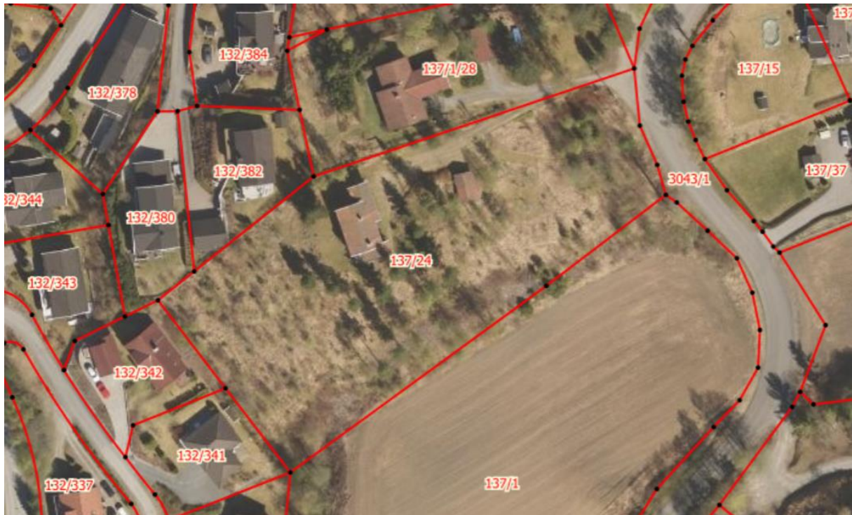
Figur 1 – Eiendommen ligger midt i bildet (137/24). Flyfotoet viser tydelig at store deler av eiendommen er skogkledd.

Arten er en blomst i leppeblomstfamilien. Den er karakteristisk og lett å kjenne igjen, med sine blå blomster i toppen av en relativt høy stilk. Utbredelsen i Norge er hovedsakelig Viken og Innlandet fylker med tettest forekomst rundt Tyrifjorden, indre Oslofjord, Randsfjorden og i nordlige deler av Mjøsregionen. Den vokser på veldrenert kalkrik jord. Arten er vektet som (VU) «sårbar» på Norsk rødliste. Det vises for øvrig til faktaark fra Artsdatabanken.