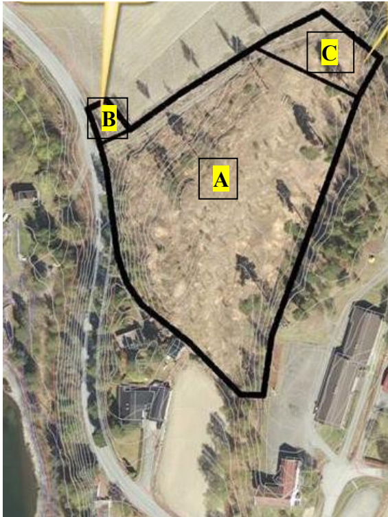
Bilde 2 - I den nye planavgrensningen er hele grusveien tatt med. Det er lagt til et område i vest (B) for å kunne planlegge avkjøring fra hovedveien, samt et område i nord (C).