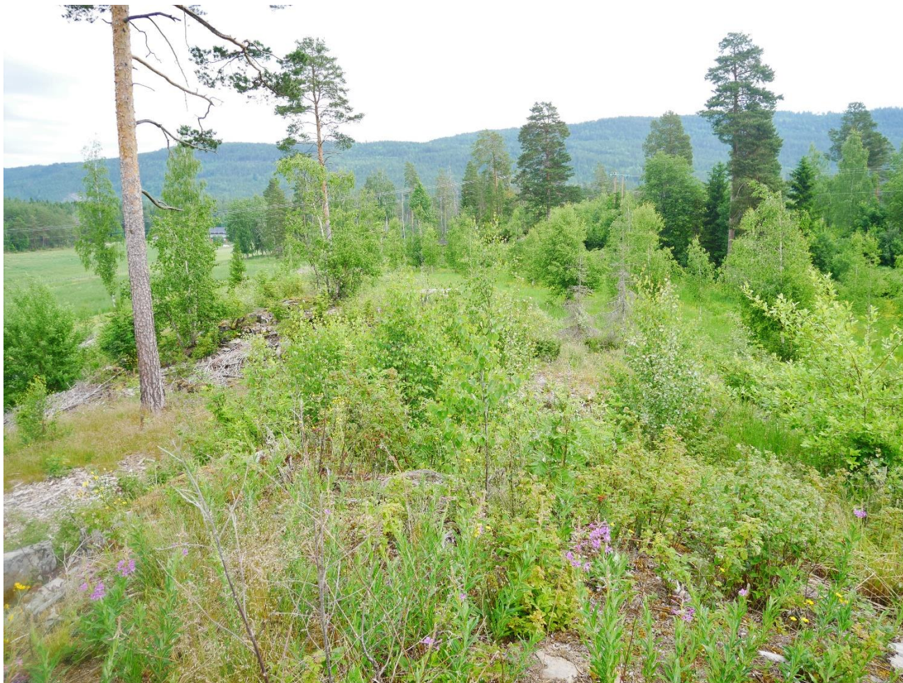
Figur 4: Planområde i nord ved Pålsrud -grenda, sett mot nord.