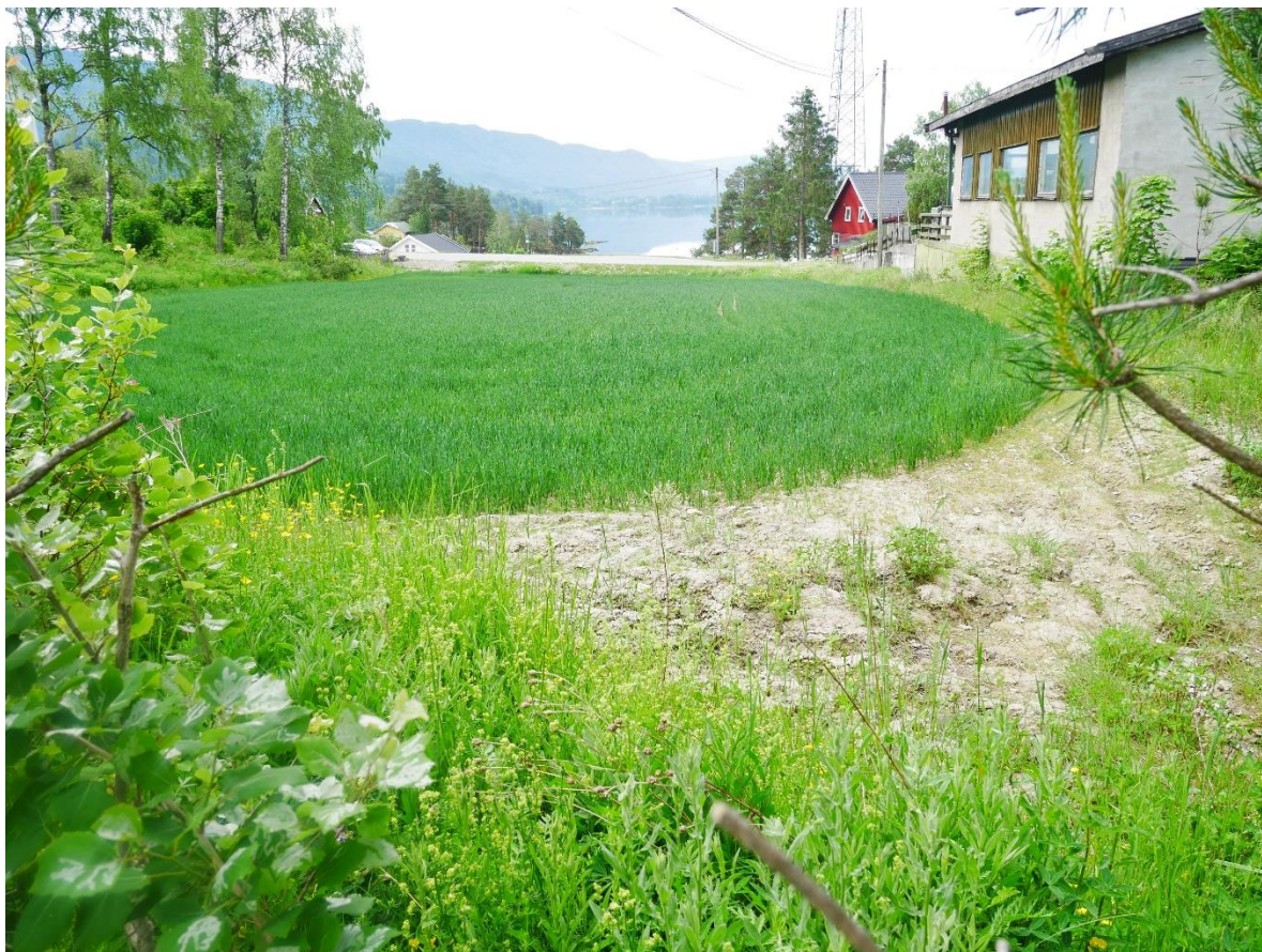
Figur 3: Område sør for plan med utsyn mot Steinsfjorden, sett mot sør.