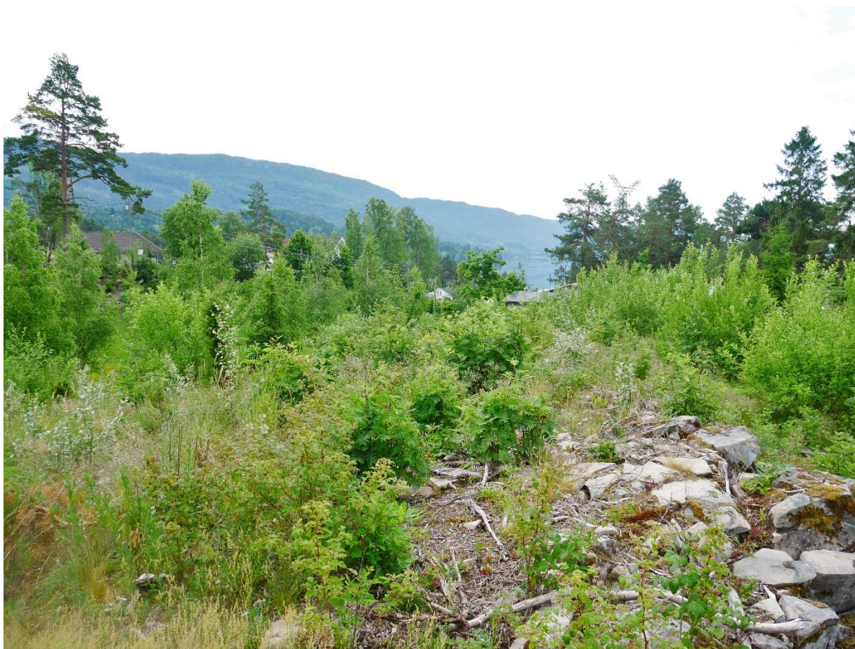
Figur 4: Oversiktsbilde av planområde sett mot sør.