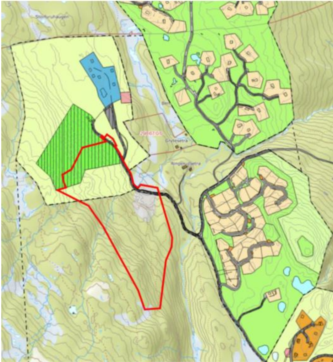
Figur 3: Tilgrensende reguleringsplaner