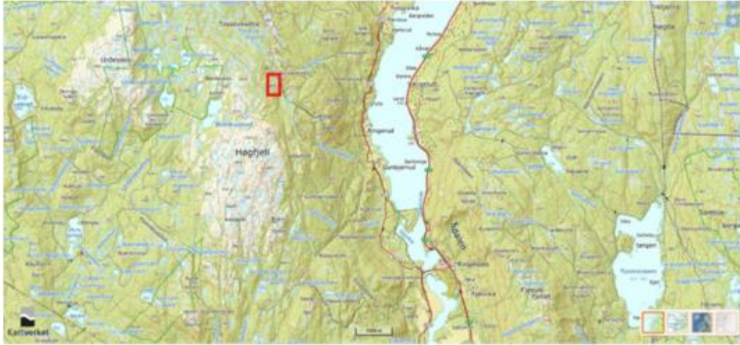
Figur 1: Oversiktsbilde, planområdet avmerket med rødt.