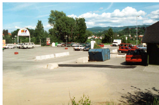
Det er mange "grå" arealer i bysentrum. Fra Tippen.

Grønn Plakat er ikke en plan for hvordan en framtidig grønnstruktur skal utvikles. Den er en registrering av eksisterende verdier, og har ingen forslag til tiltak for forbedring av grønnstrukturen. Den er heller ikke et grunnlag for å vurdere hvor fortetting kan skje. Kartet viser at det er en del "grå" områder, hvor det er mangler i dagens grønnstruktur. Grønn Plakat tar ikke stilling til hva som bør gjøres i disse områdene. Målsetningen er at Grønn Plakat skal følges opp med en grøntplan, hvor man gjennomgår de mangler og behov som dagens grønnstruktur har, og hvor det inngår en handlingsplan for videre utvikling av de grøntområdene.