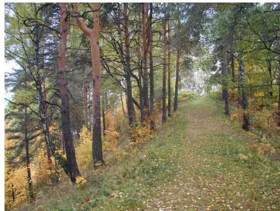
Grøntområde med verdi både som naturområde, landskapselement og tur-/lekeområde. Fra St.Hanshaugen.

Når man bor i en by har man mistet den nære kontakten med natur- og kulturlandskapet som man har ved en spredt bosetting, men man har til gjengjeld mange andre kvaliteter og fordeler, f.eks. med nærhet til sosiale miljøer og servicefunksjoner. Man har imidlertid fortsatt behov for områder for rekreasjon og opplevelse i grønne omgivelser. Det er derfor viktig at man i en by sikrer at det bevares og opparbeides grøntarealer som tilfredstiller våre behov for en god grønnstruktur også i de tettbygde bomiljøene.