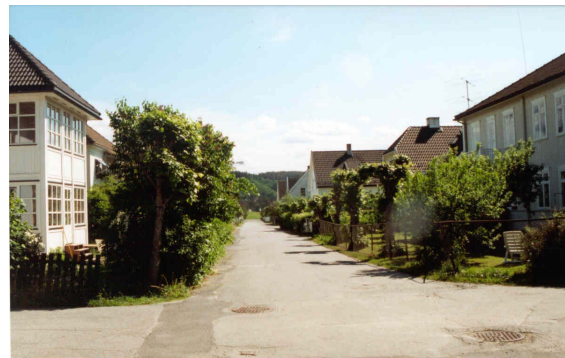
Vegetasjon på private tomter har stor betydning for det visuelle inntrykket byen gir. Fra Løkken.