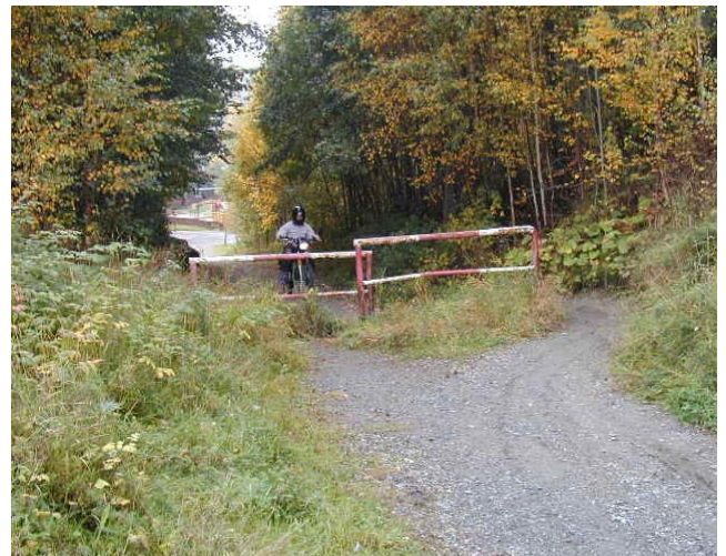
Snarveger i boligområdene er viktige, unntaksvis også for motorisert ferdsel...

D. Grønnstrukturen som ledd i transportnettet. Dette gjelder både de opparbeidede turvegene og gang/sykelvegene, og de små stiene og smetene som gir snarveger gjennom byen. Særlig utsatt er de små snarvegene, som har stor betydning for tilgjengeligheten, men som ofte er dårlig kartlagt, og som derfor særlig er utsatt for nedbygging og stengning.