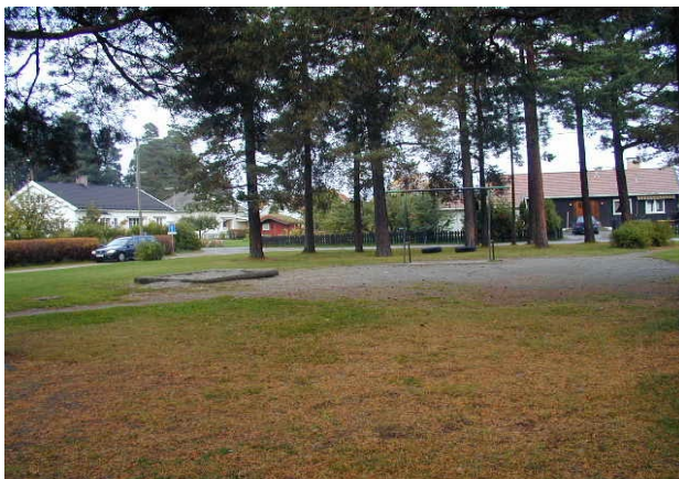
Lekearealer i boligområdene er møtesteder for både store og små. Fra Veienmoen.

Ulike grupper i befolkningen har ulike behov når det gjelder leke-, oppholds- og rekreasjonsarealer, og det er derfor viktig å sikre en variert grønnstruktur som gir mulighet for varierte opplevelser. Naturområder som “eventyrskog” for barna, tilrettelagte lekearealer, parkområder, møteplasser, større områder for kveldsturen, samt korridorer som gir god tilgang til større friluftsområder er blant elementene som bør være med.