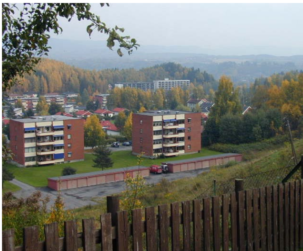
Åsryggene og skråningene i og rundt Hønefoss er karakteristiske for byen, og bidrar til å avgrense byrommene. Her ser vi utover Haldenjordet, og åsryggen bak trygdeboligene i Krokenvegen.

Grønnstrukturen er viktig som en del av de nære omgivelsene, med lekeområder, grøntbelter, enkelttrær, vassdrag m.v., men har også vesentlig betydning for vår oppfattelse av de store trekkene i landskapet.