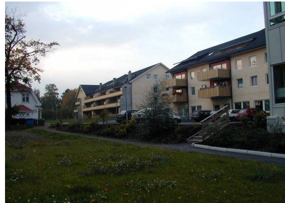
Fortetting i bysonen er positivt, men krever vurdering av behov for grønne strukturer. Fra Kinohaven og Sundhaven.

man oppnå gjennom en overordnet planlegging av grønne strukturer, og en slik vurdering vil være et nødvendig grunnlag i forbindelse med fortetting i bysonen.