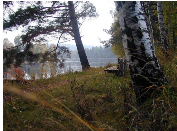
Elvene er viktige for byens grønnstruktur, både som rekreasjonsområde og som landskapselement. Fra Petersøya.

Byens plassering i landskapet, med hovedtrekkene i terreng og vegetasjon, har stor betydning for inntrykket av byen og for byens identitet. Hønefoss har relativt intakte grønne dalsider og åser rundt og inne i byen, som bidrar til å gi byen et grønt preg, og som avgrenser byområdet. Et annet element som har vesentlig betydning for byens særpreg er elvene og vegetasjonssonen rundt disse. Disse hovedtrekkene har stor betydning for det grønne inntrykket byen har i dag. Samtidig er de med på å vise hvordan byen har utviklet seg, tilpasset til ferdselsårer og barrierer som de naturlige omgivelsene har gitt.