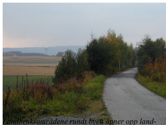
Landbruksområdene rundt byen åpner opp landskapet og gir utsyn over kulturlandskapet.