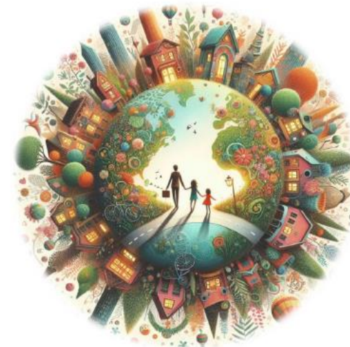
Figur 1 Bildet er generert av kunstig intelligens