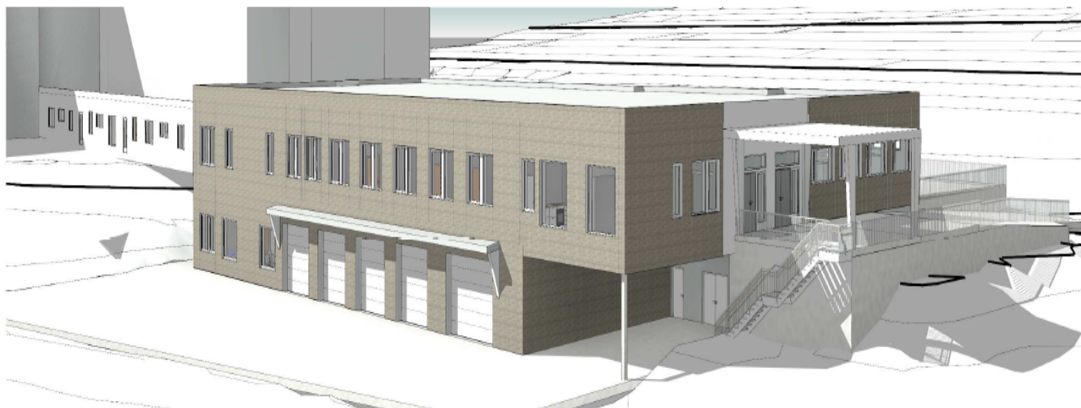
Perspektiv fra sørøst