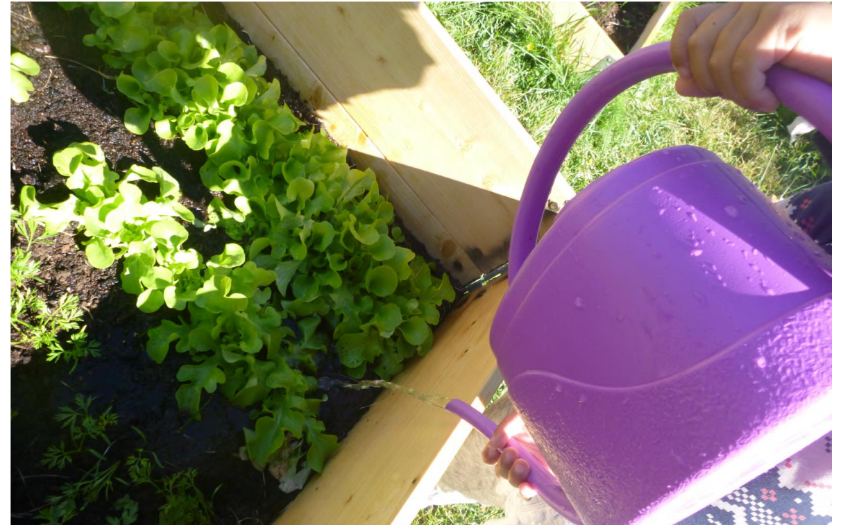
Bilde fra Ullerål barnehage