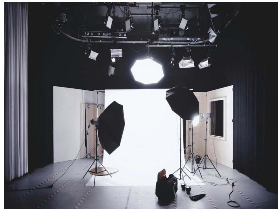
Fotostasjon til Ganske Fint brukthandel AS.