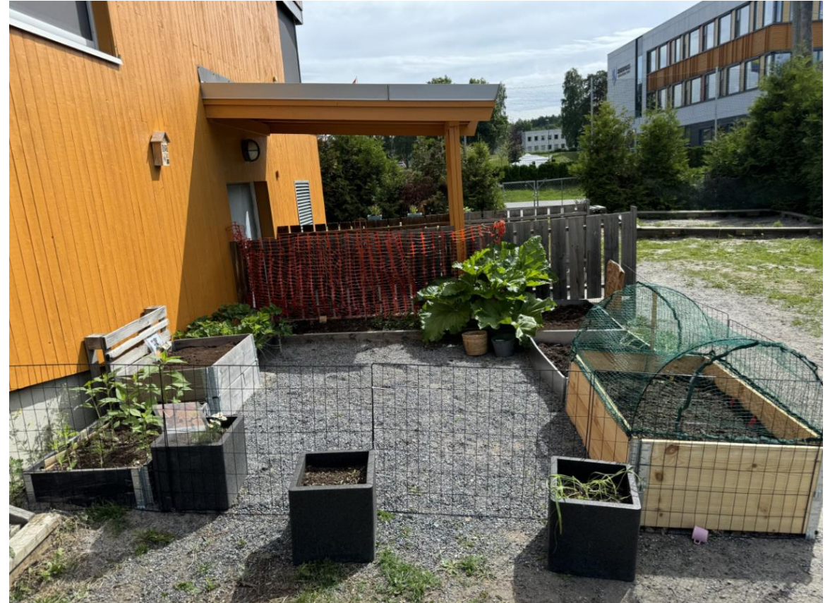
Kjøkkenhage Eikli barnehage.