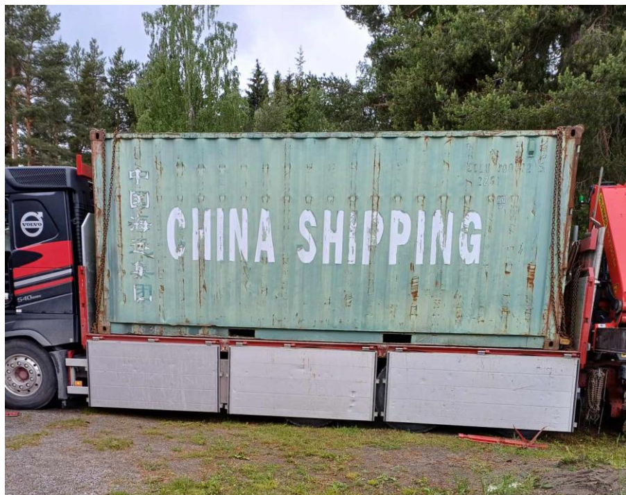
Container til Nakkerud ungdomslag