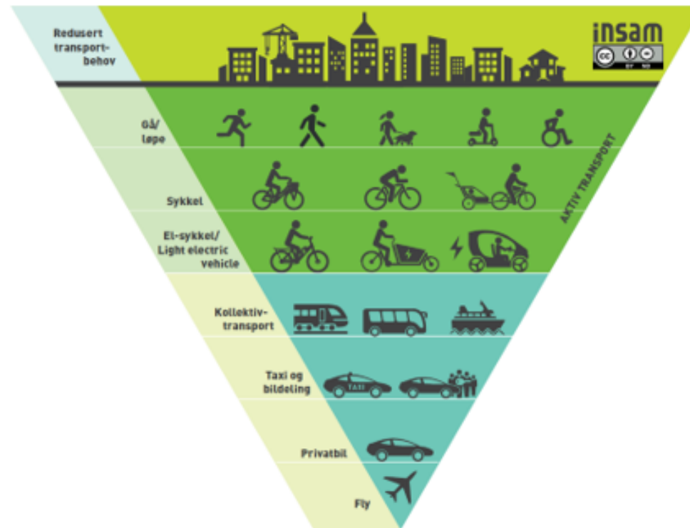
Figur 2 Pyramiden for mobilitetsprioritering (tatt fra Insam )

Transporttriangleret nedenfor viser hvordan reisevanene våre bør være for å øke tilgjengelighet, livskvalitet, økonomiske levedyktighet, sosial likhet, helse og miljøkvalitet i Hønefoss. I Ringerike er andelen som bruker privatbil betydelig. Vi bør gå eller sykle fremfor å bruke privatbil for å få mer plass til å øke bylivet og trivselen i byen.