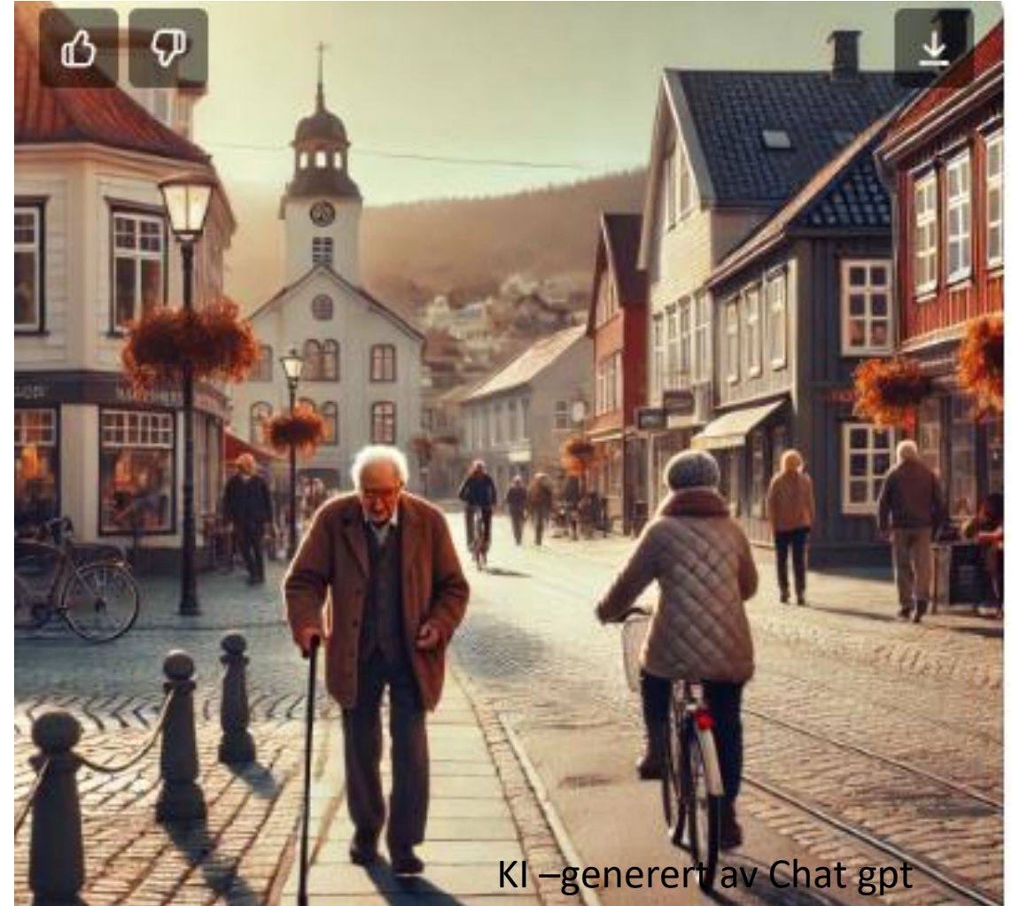
KI – generert av Chat gpt