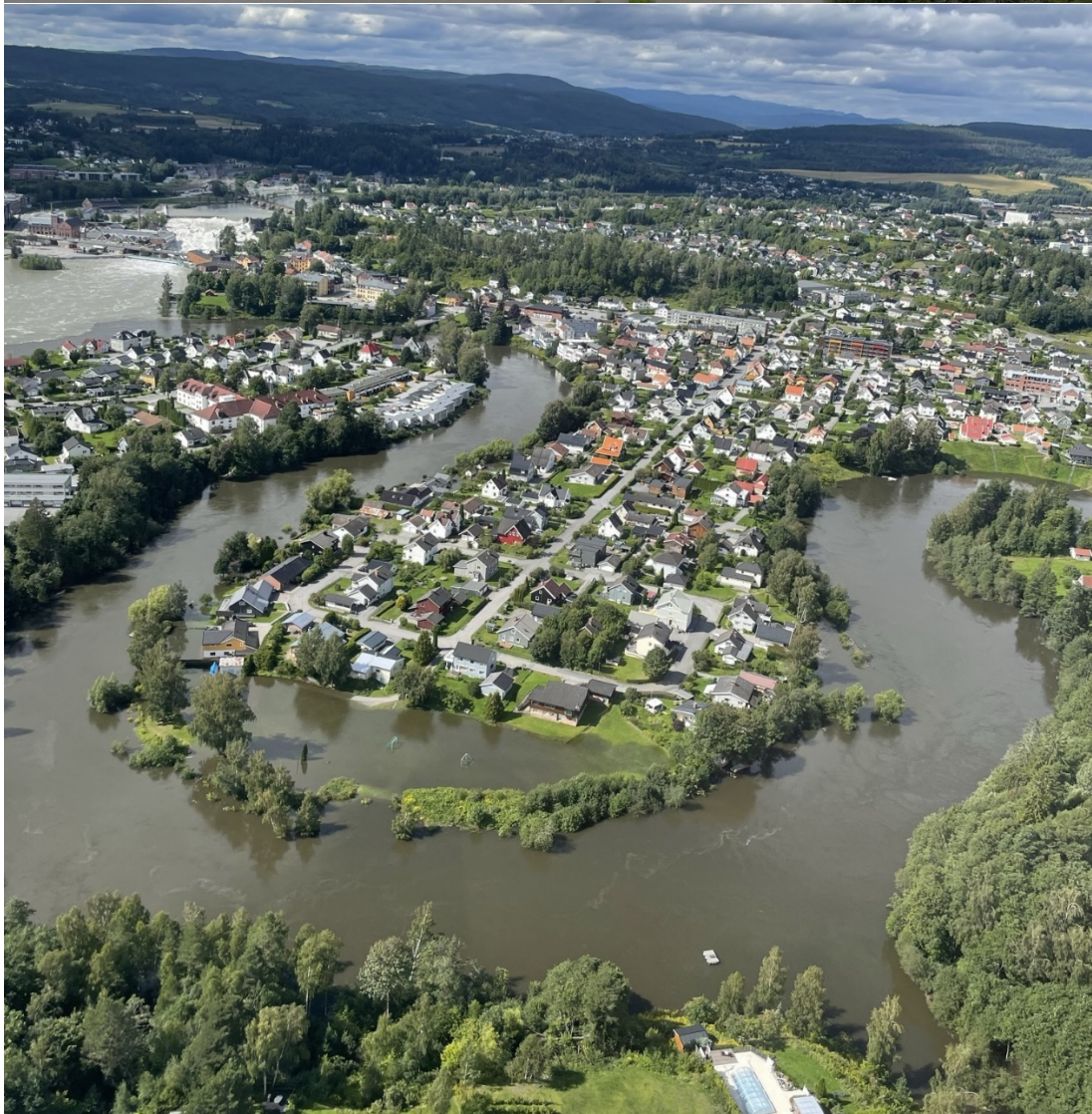
Oversvømmelsene, som også bidro til at grunnvannet steg vesentlig i disse områdene, gikk hardt utover veier, VA-stasjoner, park- og friområder og skapte usikkerhet rundt brukonstruksjoner og