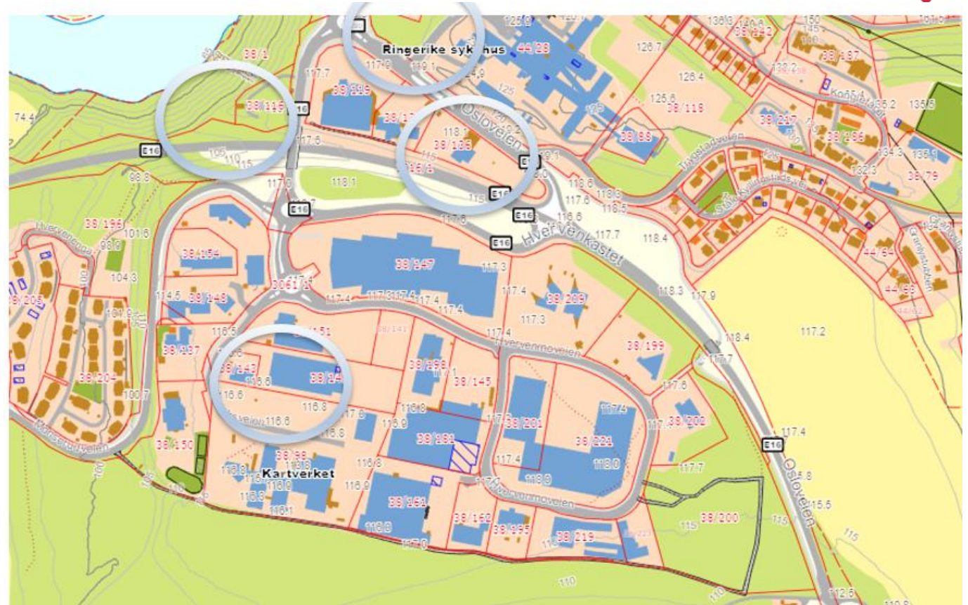
Alternativer som ikke ble med videre

Alternativer som er vurdert i mulighetstudien