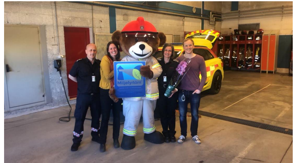
Bjørnis mottar Miljøfyrtårndiplomet for Brann- og redningstjenesten.