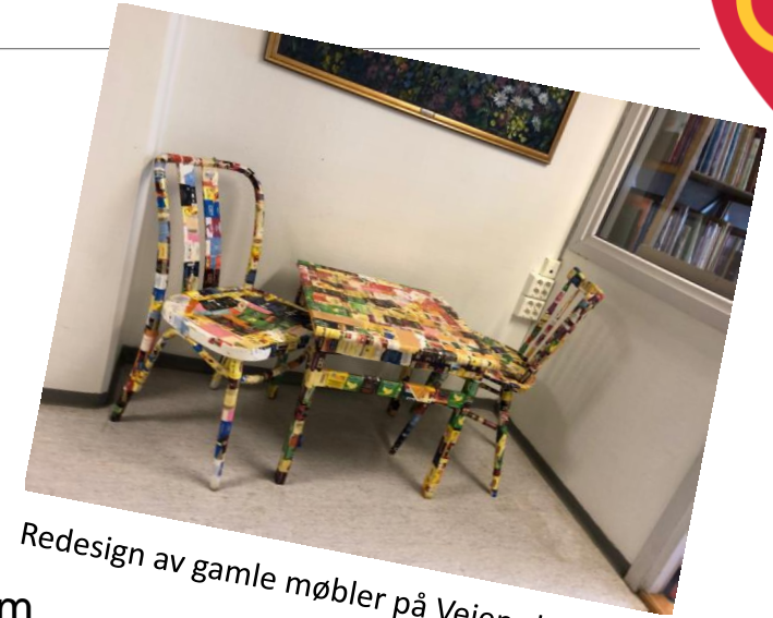
Redesign av gamle møbler på Veien skole