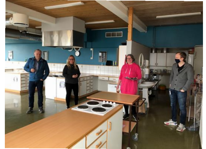
Besøk av sertifisør på Tyrstrand skole