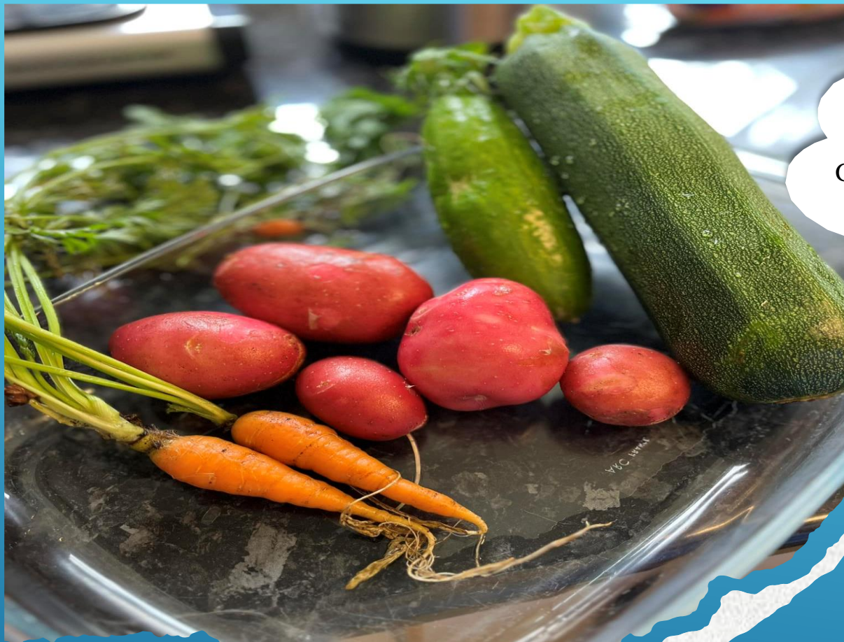
Grønnsaker fra kjøkkenhagen vår

Vennskap bidrar til en følelse av deltakelse og fellesskap, som er viktig for utvikling av positiv selvfølelse og trivsel.