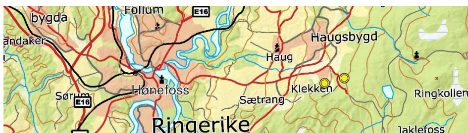
Tomtene markert med gul sirkel

Gbnr 3007-103/24, areal ca 11 daa Gbnr 3007-103/290, areal ca 22 daa