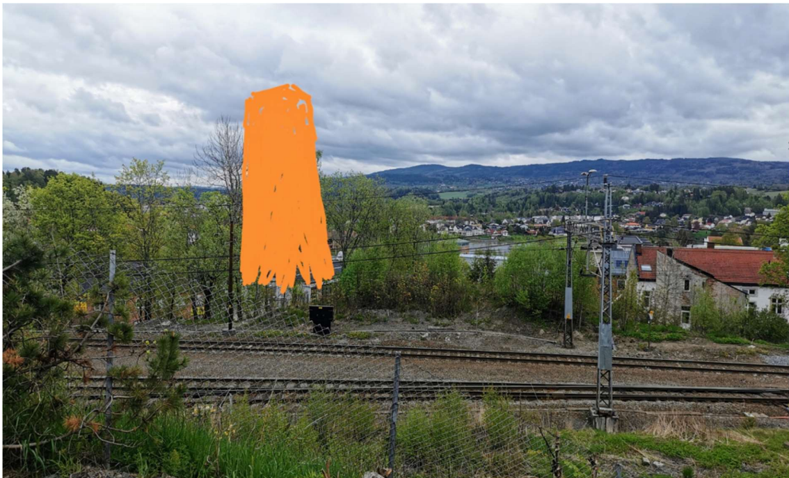
Grov visualisering av ca. høyde isolert på BKB3 sett fra Teglverket iht dagens situasjon.