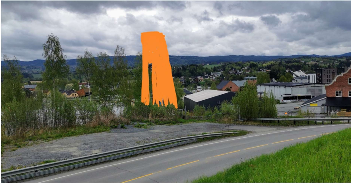
Grov visualisering av ca. høyde isolert på BKB3 sett fra fotgjengerfeltet over til jernbanestasjonen iht dagens situasjon.