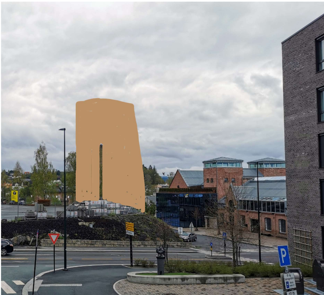
Grov visualisering av ca. høyde isolert på BKB3 sett fra Fossveien 11 iht dagens situasjon.