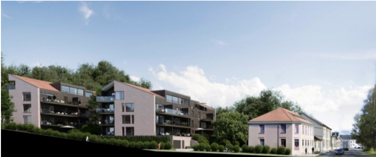
Figur 3 - Etter mange runder med kommunen ble planene for Handelsskolekvartalet justert på en god måte. Vi må møte utbyggers planer på samme måte på den andre siden av elva.

naboprotester gjorde at kommunen lyttet til innbyggerne og krevde flere revisjoner av utbyggingsplanene inntil høyder, profiler og helhetlig estetikk ble ivaretatt. Planene for Lloyd's marked er vesentlig mer inngripende, og det er ikke bare naboer, men store deler av Ringerikes befolkning som nå protesterer mot disse planene.