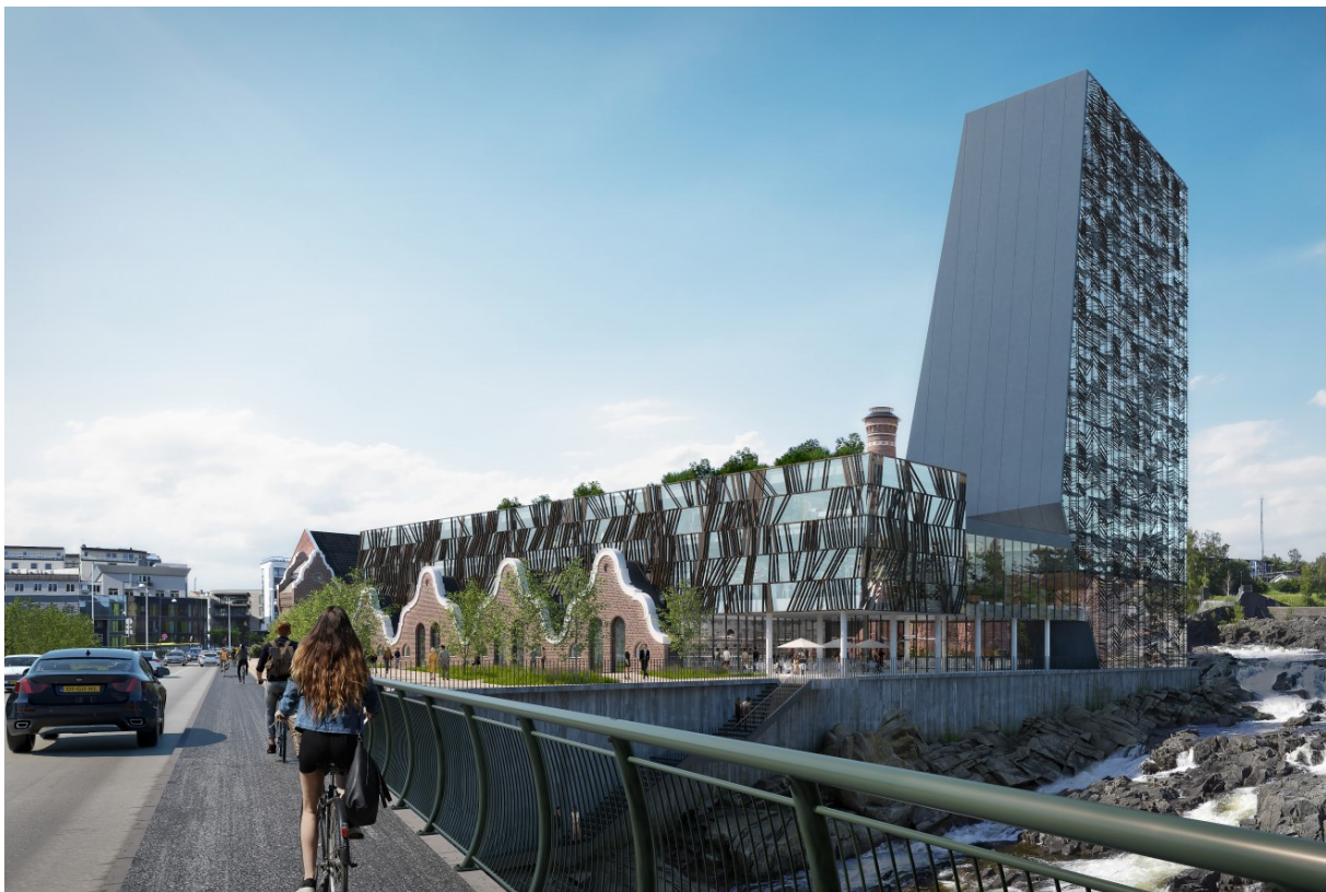
Figur 1 - Lloyd's marked sett fra brua. Legg merke til høyden på høyhuset i forhold til den historiske pipa, samt den massive vegg høyhuset danner.

Utbyggingsplanene kan virke å prioritere økonomisk gevinst på bekostning av disse verdiene. Vi ber om at de folkevalgte ser bort fra forventninger fra næringslivet om best mulig økonomisk gevinst og i stedet sette tydelige krav til et harmonisk bymiljø i tråd med Hønefoss' identitet som hyggelig småby.