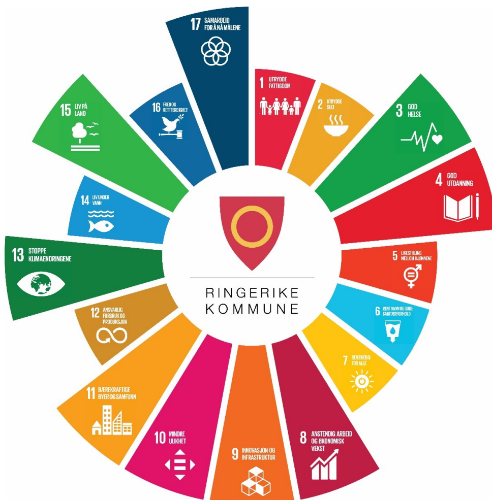
Figur 2: 9 fokusområder for Ringerike kommune

07.11.2019: Kommunestyret vedtok i sak 158/19 ni fokusområder av FNs bærekraftsmål. I tillegg ble det vedtatt « I alle saksfremlegg i folkevalgte organer skal det stå hvilke (+) mål som blir støttet og på hvilken måte det blir gjort. » Fokusområdene ses i figuren under.