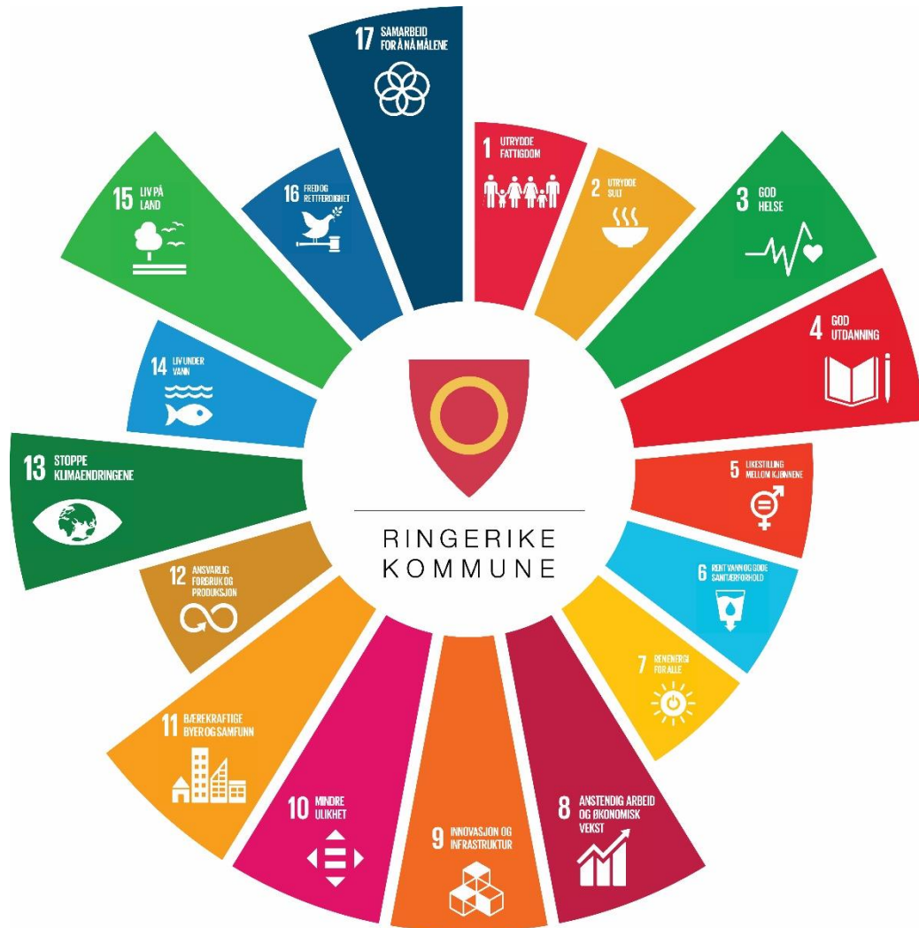
Figur 2: FNs bærekraftsmål, fokusområder for Ringerike kommune