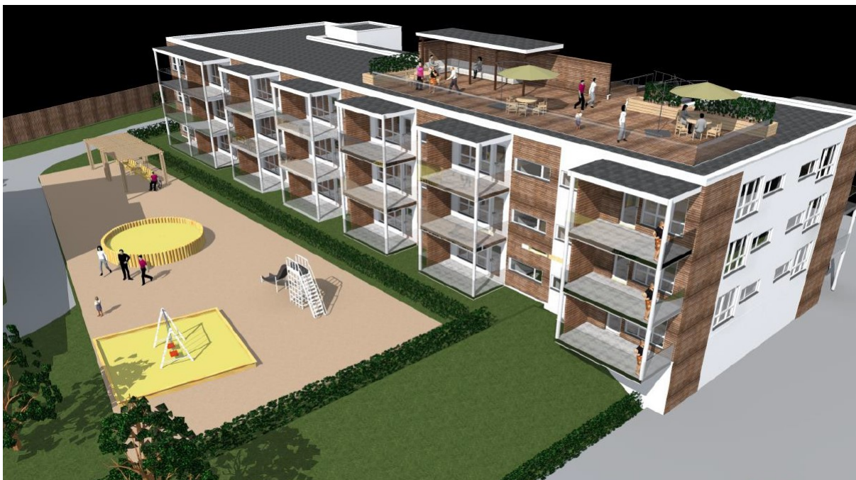
Illustrasjon av østre blokk med takterrasse, en fin kvalitet for beboere.