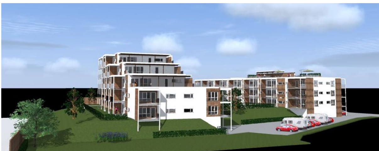
Prosjektet sett fra sør mot nord, Hønengata til venstre.