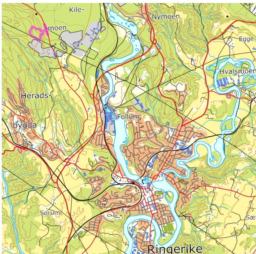
Bilde 1: Planområdet er vist med rosa omriss. Planområdet er ca. 5 km nordvest for Hønefoss, på Kilemoen.

Planområdet er delt inn i to vertikale nivå. Vertikalt nivå 1 omfatter fjellanlegget under bakkenivå. Vertikalt nivå 2 omfatter området over fjellanlegget og parkeringsplass/vei. Se plankart vedlegg 2 og 3.