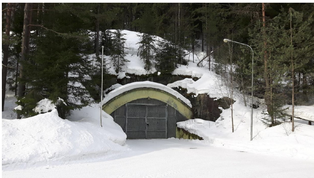
Bilde 2: Viser tunnelåpningen. Det er kun en inngang som leder inn til begge tunellene.