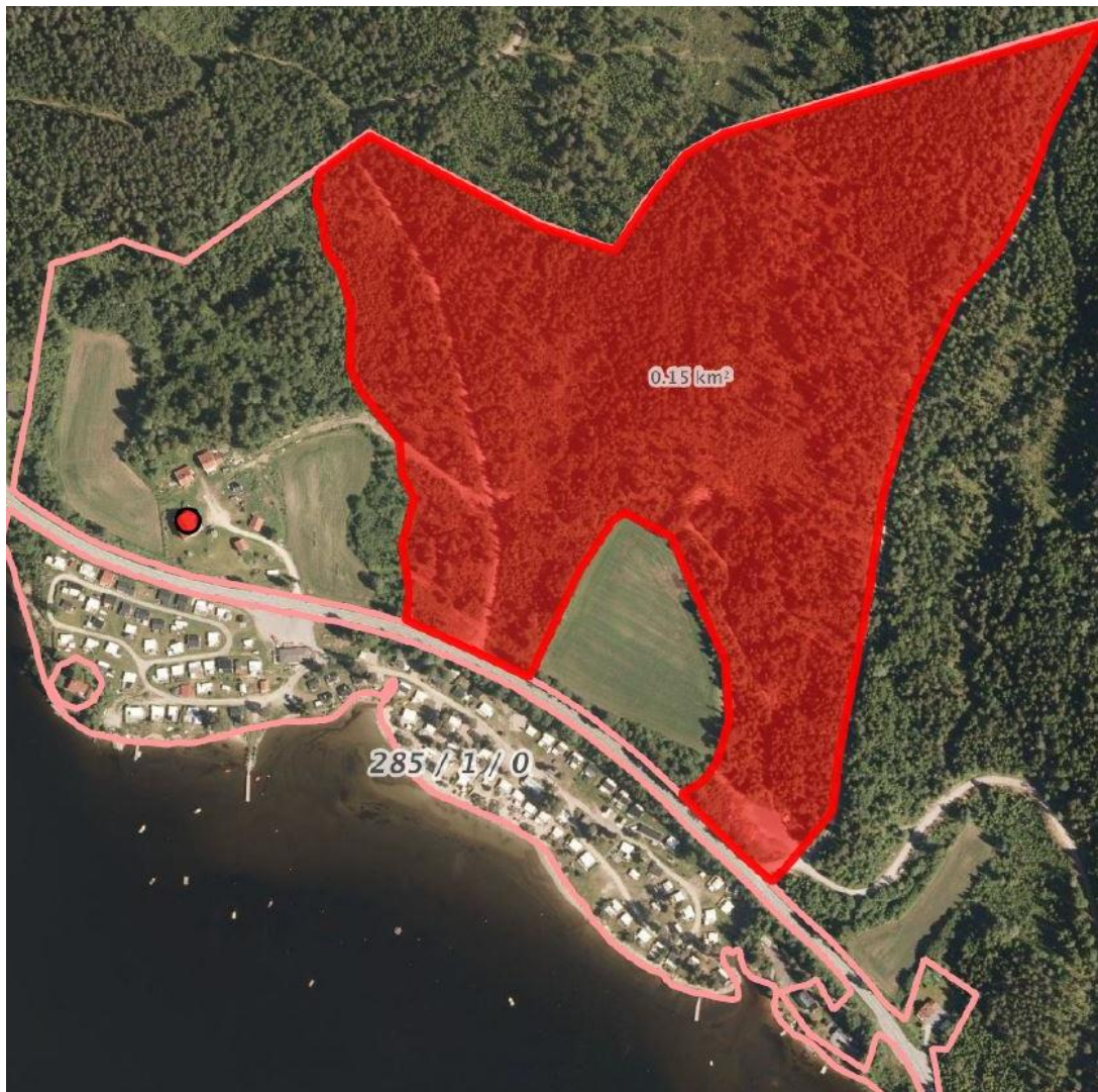
Skisse: Planområdet skissert på flyfoto med eiendomsgrense

Arealet strekker seg fra Dælabekken i vest til skogsbilvei ved Åbortjernbekken i øst. Planområdet avgrenses naturlig av E16 i sør og av eiendomsgrensa i nord. Et område på ca. 13 daa dyrket mark utelatt fra planområdet. Området er vendt mot sør-vest i en svak helning.