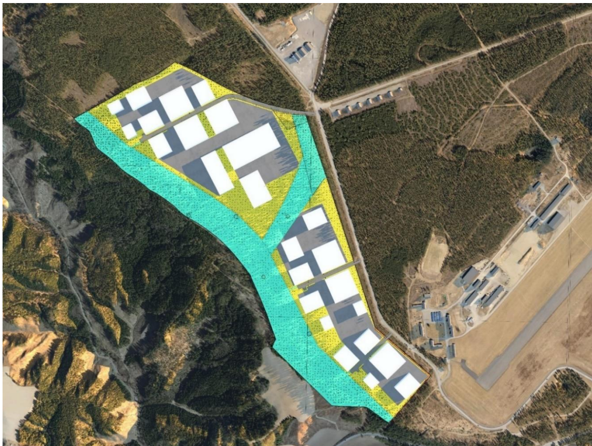
Illustrasjoner av volumer (COWI) Fugleperspektiv

Det er utarbeidet volumstudier som viser maks utnyttelse av området. I en type industripark vil utforming av bygg avhenge av hvilke aktører som velger å etablere seg.