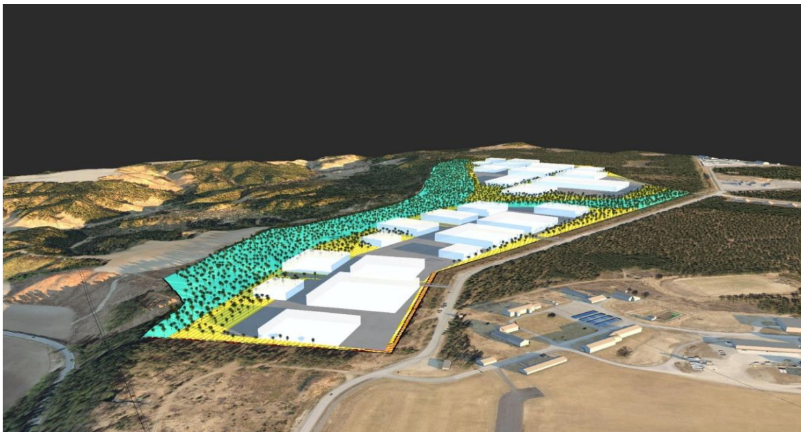
Illustrasjoner av volumer (COWI), området sett fra sør. Flyplass og tidligere forsvarsanlegg ned til høyre på illustrasjonen.