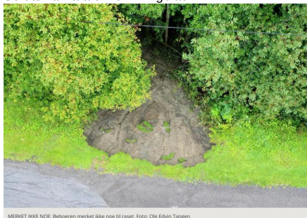
MERKET IKKE NOE. Beboeren merket ikke noe til raset.