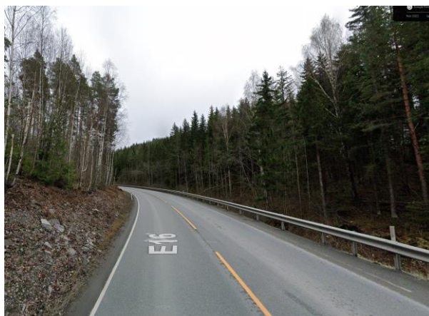
Bilde fra google street view av strekningen