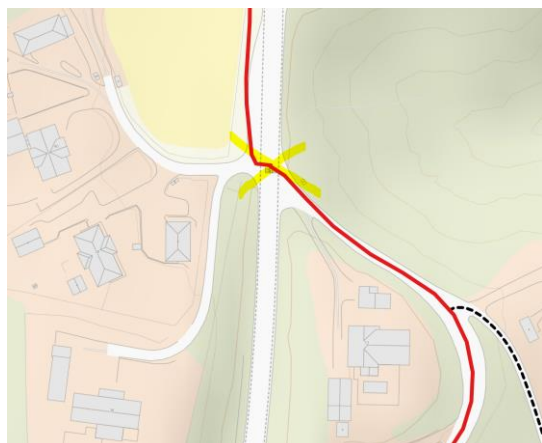
Utsnitt fra kommunes forslag. Behov for kulvert

Kommunens forslag legger opp til kryssing av E16 ved ådalsveien 33 og 38. Dette må skje i kulvert noe som er kostbart og vanskelig å gjennomføre da det er ustabile grunnforhold.