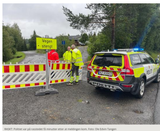
RASKT! Politiet var på rasstedet få minutter etter at meldingen kom.

Se artikkel: https://www.ringblad.no/matte-evakuere-til-klakken-hotell-etter-jordras-litt-skummelt/s/5-45-1699619