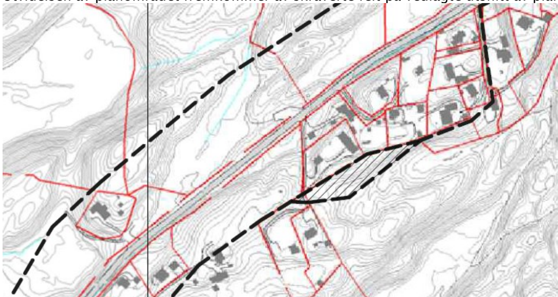
Skravert område viser utvidelsen av planområdet.

Utvidelsen av planområdet fremkommer av skraverte felt på vedlagte utsnitt av planområdet: